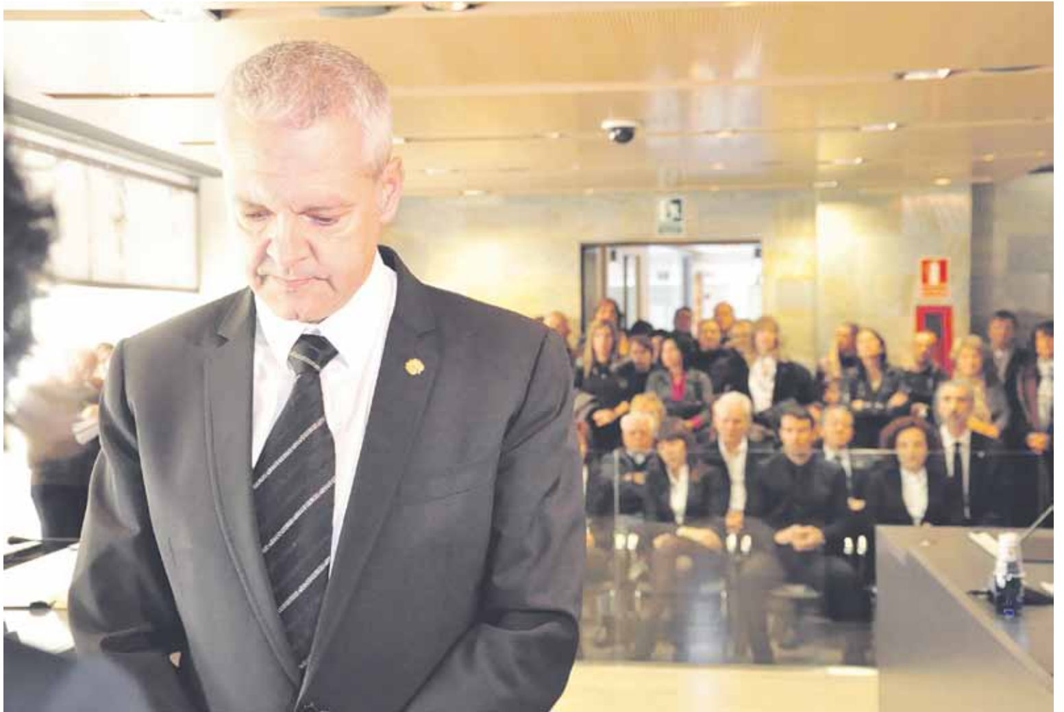
El cònsol major, Ventura Espot, a la sala del Consell en el moment de jurar el càrrec el mes de desembre passat.

un 14,35% per sota del pressupost anterior. Es tracta d'un pressupost continuista, quant a la contenció i l'optimització de la despesa per adaptar-se a la davallada d'ingressos, ja que la previsió és que sigui un 4,26% inferior respecte del 2011. La contenció en els números presentats va quedar reflectida en una rebaixa del 2,14% de la despesa corrent en relació amb l'exercici anterior.