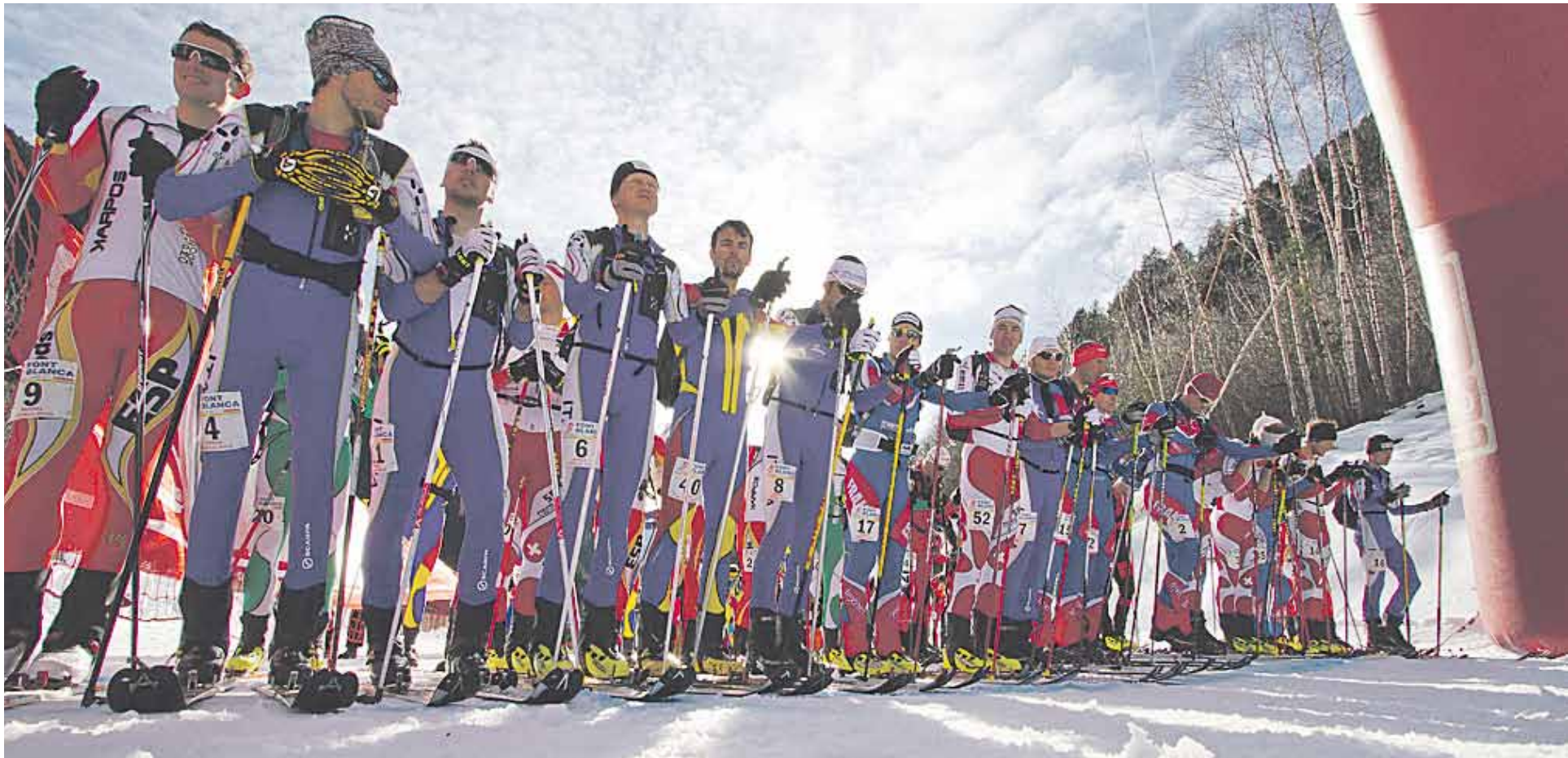
Els participants masculins preparats moments abans de la sortida de la Copa Font Blanca, enguany puntuable per a la Copa del Món.