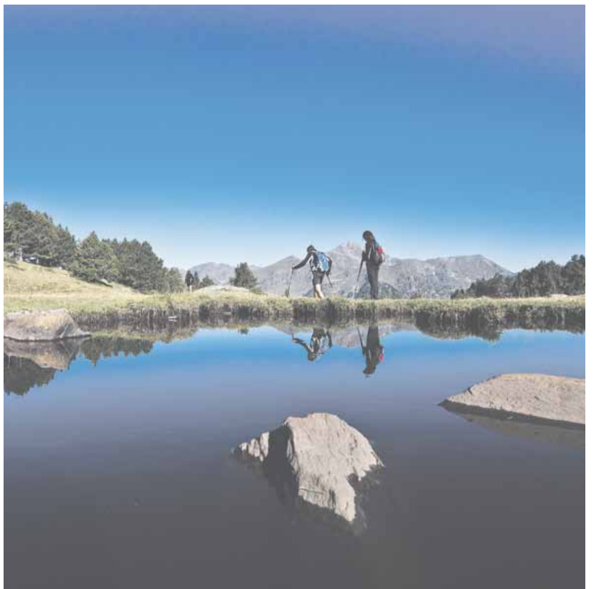
Una espectacular vista de l'Estanyó, proposta inclosa a la guia, amb dos excursionistes caminant.

sigles XS, S i M, tenen un recorregut màxim de 8 quilòmetres i un desnivell que no supera els 750 metres. «No s'hi inclouen crestes, ni grans sortides, ja que ens adrecem exclusivament a un públic familiar», asseguren, tot i que confien poder oferir aquesta informació en un nou projecte editorial de característiques similars. El nivell més baix, l'XS, estarà identificat sobre el mapa amb el color groc i s'utilitzarà en els recorreguts de 2,5 quilòmetres i 250 metres de desnivell; els camins S, que integren el segon nivell de dificultat, tindran 5 quilòmetres de recorregut i un desnivell de 500 metres. Finalment, els recorreguts més extensos no superaran els 8 quilòmetres de llargada ni els 750 metres de desnivell. El mapa, que vol ser el màxim d'explicatiu, contindrà una llegenda descriptiva mitjançant icones. La publicació de la guia, en canvi, es podria presentar en format de fitxes amb una informació més àmplia, com ara la definició de les rutes, la rellevància en el context històric i social i el detall de les espècies animals i vegetals que es poden trobar a la zona «No ens hem tancat en banda, un exemple és la proposta d'agafar el telecadira de Creussans, coronar el cim de Peyreguils i baixar fins als estanys de Tristaina». I afegeix: «És una zona preciosa, de gran interès, però en lloc de voltar-la pel cercle a 2.500 metres, anirem arran d'aigua, a uns 2.200 me-