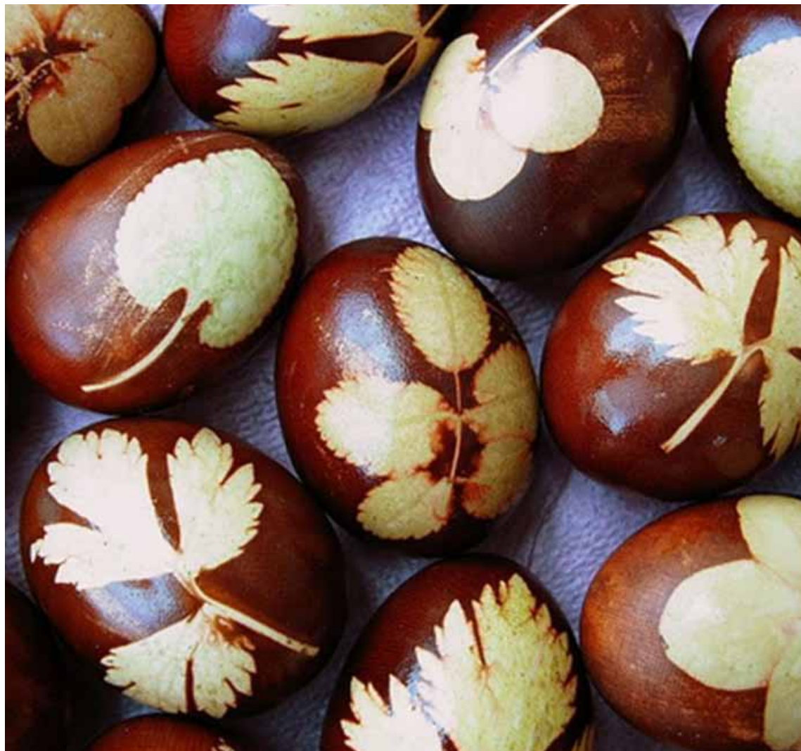
Imatge dels ous tradicionals de la Pasqua letona, tenyits i estampats amb fulles d'arbre.

viduslaikos Lieldienas svinēja veselu nedēļu, vēlāk svinību laiks tika ierobežots līdz trim dienām. Šajā laikā tika veikti dažādi ar saistīti rituāli, no kuriem pieminēšu tikai dažus.