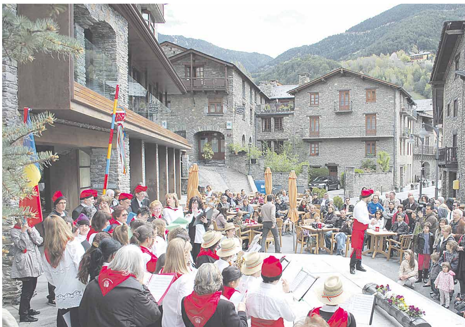
Celebració de les Caramelles a Ordino, festa declarada patrimoni de la humanitat per la Unesco.