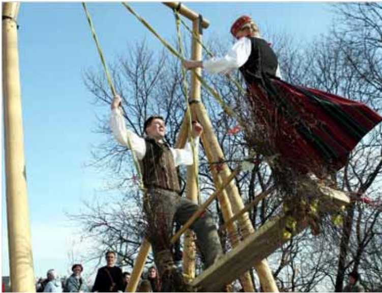
Dos joves es gronxan seguint la tradició letona.

vajadzēja iet šūpoties. Kādā plašā vietā tika uzstādītas šūpoles, kur tad ļaudis no apkārtnes nāca šūpoties.