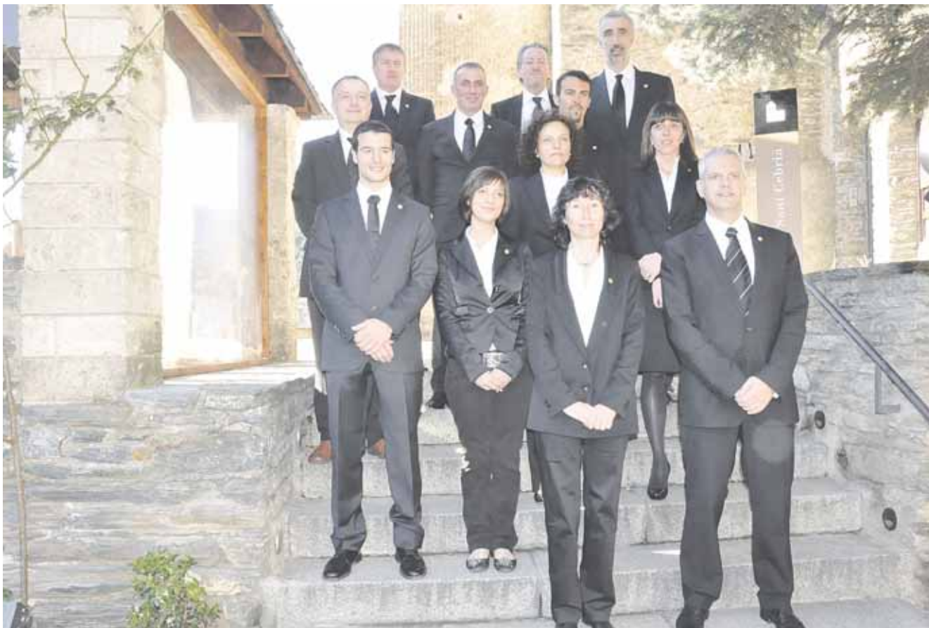
▲ Foto de grup a les escales de l'església, el dia del jurament dels càrrecs.

Els cònsols reelegits, amb un equip renovat en gran part, volen donar prioritat als temes socio-sanitaris