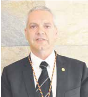
BONAVENTURA ESPOT BENAZET Cònsol major i conseller del Camp de Neu Ordino-Arcalís, conseller d'Obres i Urbanisme i conseller de la comissió mixta de límits parroquials

El cònsol major tindrà noves assignacions en aquest mandat, amb la creació d'una comissió mixta que treballarà en la definició dels límits parroquials.