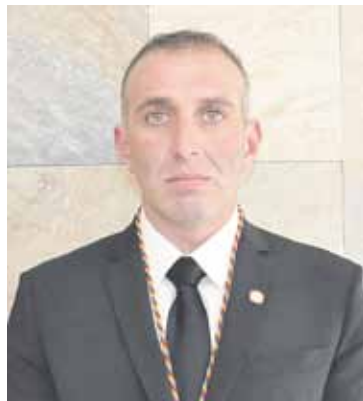
MIQUEL PUJAL RIUS Conseller d'Agricultura i Medi Ambient

Dóna prioritat a un acostament amb la ciutadania a través de reunions veïnals per resoldre els problemes del dia a dia. El seu altre objectiu és potenciar el reciclatge entre la població.