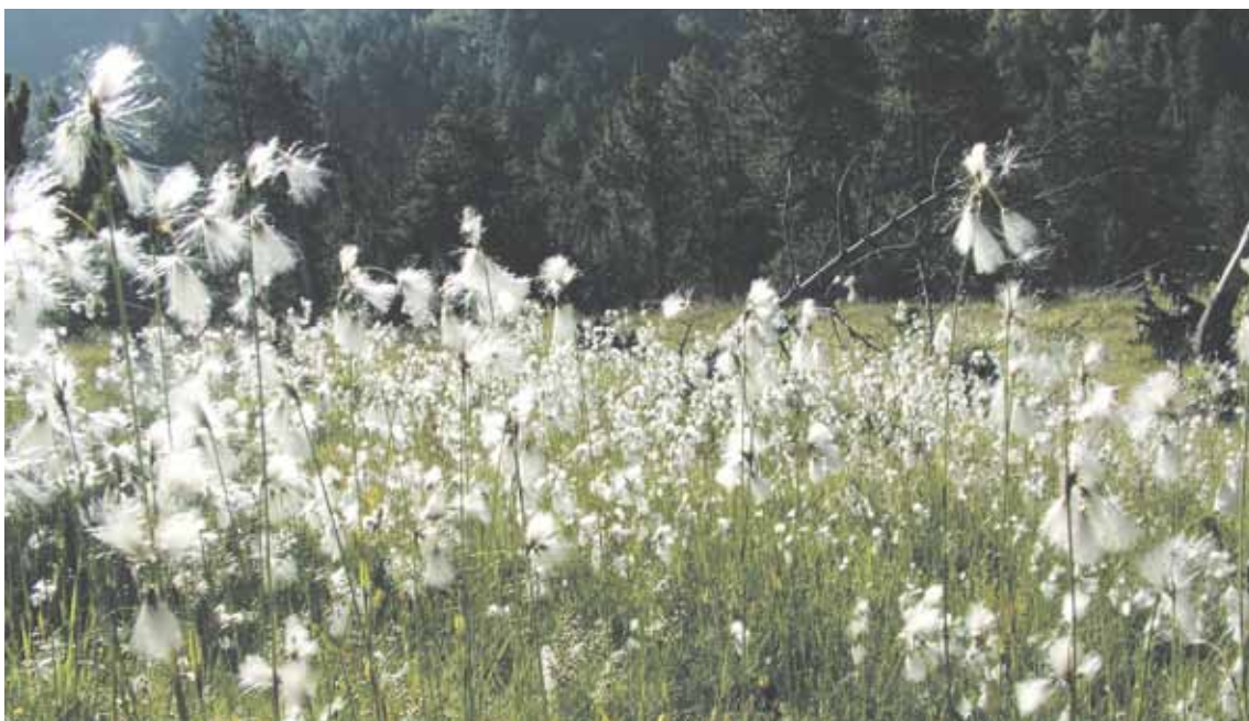
Mollera de la Font de la Mata, al pla de Sorteny, amb explosió de cotoneres.

La importància dels ecosistemes de les zones humides es fa palesa a escala mundial amb la signatura del Conveni de Ramsar, al qual el Ministeri de Turisme i Medi Ambient del Govern d'Andorra s'ha volgut afegir. La signatura, aprovada al Consell de Ministres, ha permès que l'àrea de Patrimoni Natural hagi presentat la candidatura de les molleres de la vall de Sorteny a la llista internacional de la Unesco. La relació de zones humides conté més de 1.500 indrets inventariats, dels quals la majoria pertanyen al Canadà i al Regne Unit. A la proposta andorrana s'han inclòs les 59 molleres del Parc natural d'Ordino, que ocupen una superfície de 22 hectàrees de les més