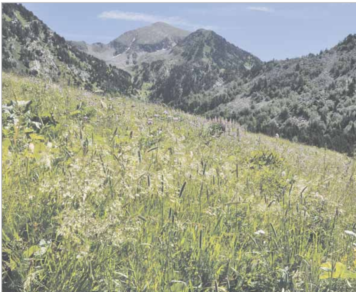
La vall de Sorteny va ser declarada Parc natural l'any 1999, el primer del Principat.

La Casa Pairal organitza un quinto la diada de Sant Jordi.