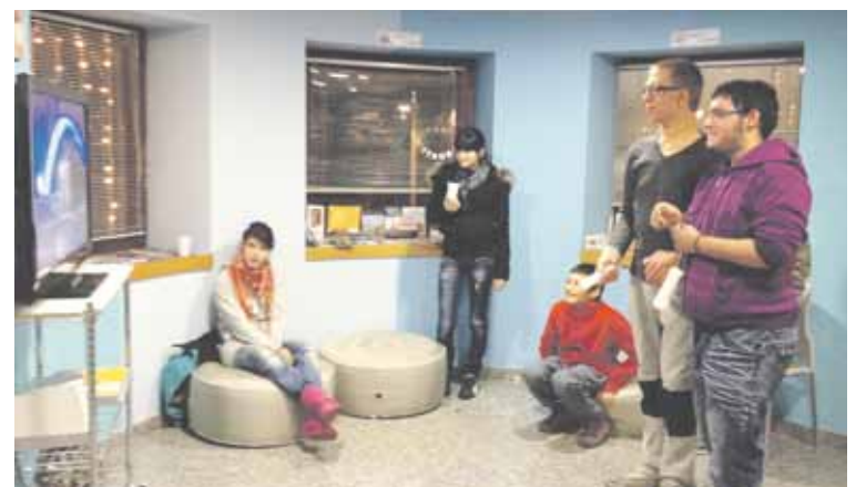
Dos usuaris del PIJ juguen una partida amb la Wii.

mes d'ensenyament, habitatge, treball o sexualitat han estat algunes de les inquietuds manifestades pels usuaris. Al Punt d'Informació Juvenil es trameta també el Carnet Jove, cosa que permet als usuaris beneficiar-se de descomptes i promocions tot l'any. Conjuntament amb la Massana s'organitzen activitats en els períodes de vacances escolars, com l'Snow Day Jove i la Primavera Jove, en què es promouen principalment els valors esportius.