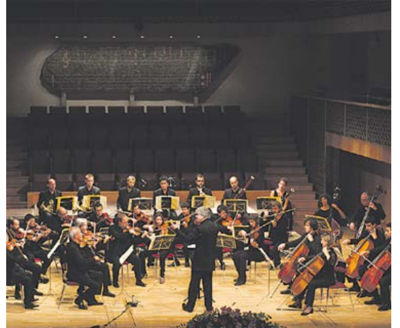
Actuació de L'ONCA al Festival Narciso Yepes 2012.