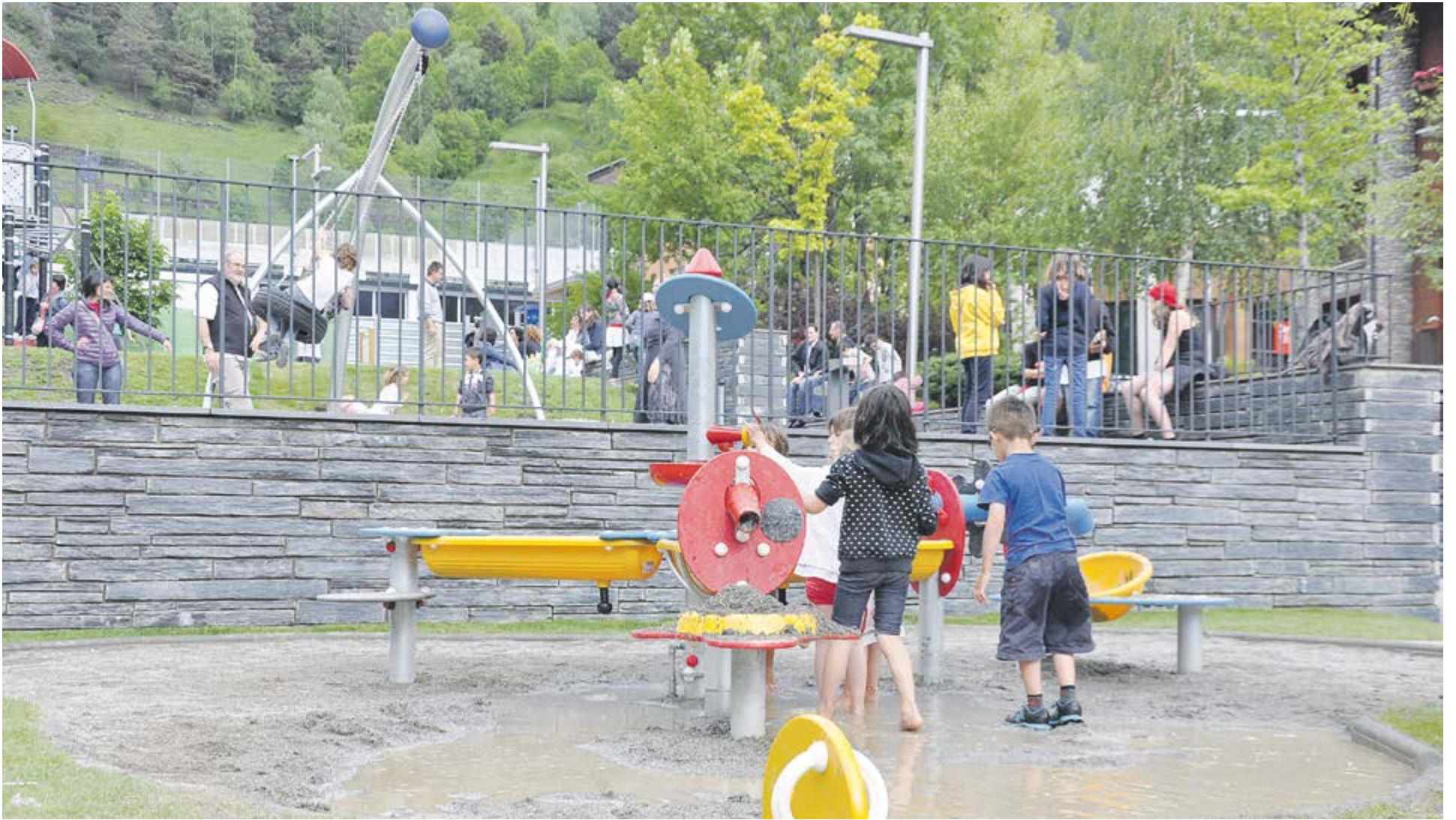
En primer pla, l'atracció estrella dels nous elements de joc, el circuit d'aigua instal·lat en un sorral, en què molts nens juguen descalços. A dalt, el gronxador pneumàtic.