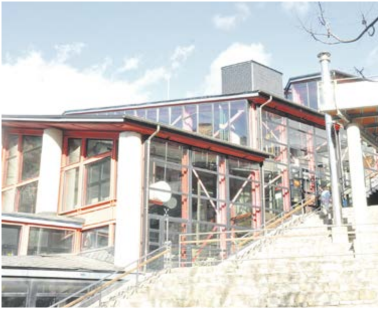
Façana exterior original del CEO, construïda en vidre.

Amb la mínima afectació possible als usuaris, el Centre Esportiu d'Ordino afrontarà durant el 2014 l'última fase, i la més visible, del procés d'ampliació i reforma de les seves instal·lacions. Després de convocar el concurs públic per a una auditoria energètica capaç de detectar i proposar mesures per aconseguir l'estalvi energètic, el CEO vol ser l'edifici de referència quant a l'ús de les energies renovables. La importància