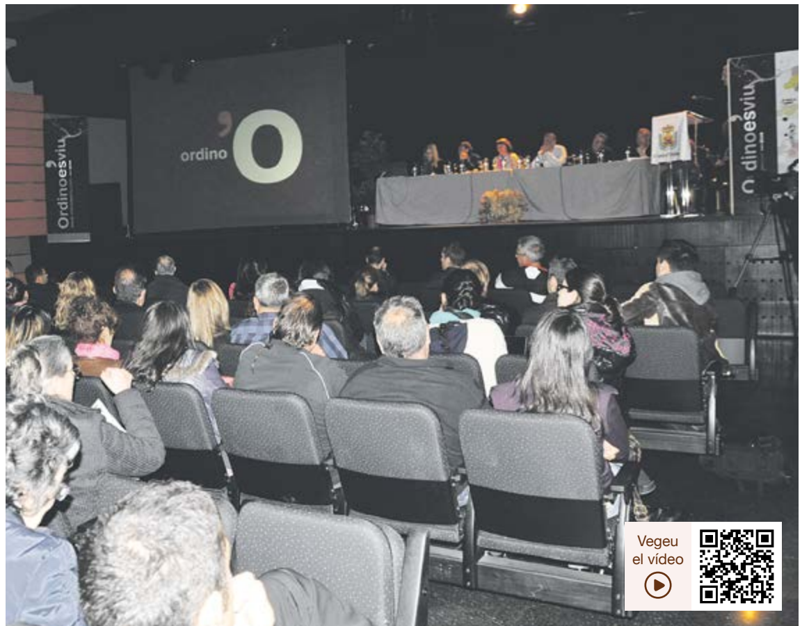
Una vuitantena de parroquians es van acostar a l'Ordino Studios per seguir la reunió de poble.

FINANCES. L'equip comunal va fer una exposició oral estructurada per conselleries, en què cada responsable va mostrar el més destacat de la seva gestió durant aquest any i mig de feina. A la reunió també es van deixar veure les línies de treball actual dels departaments que