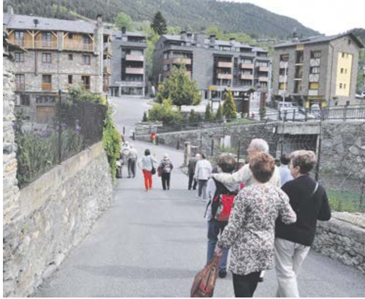
Turistes baixant pel carrer de la Grau i admirant els horts.

La població juvenil es manifesta més descontenta quant a la