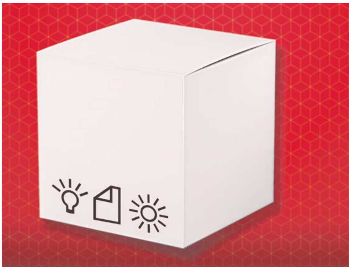
Imatge de la campanya promocional del nou espai de creació anomenat La Capsa.