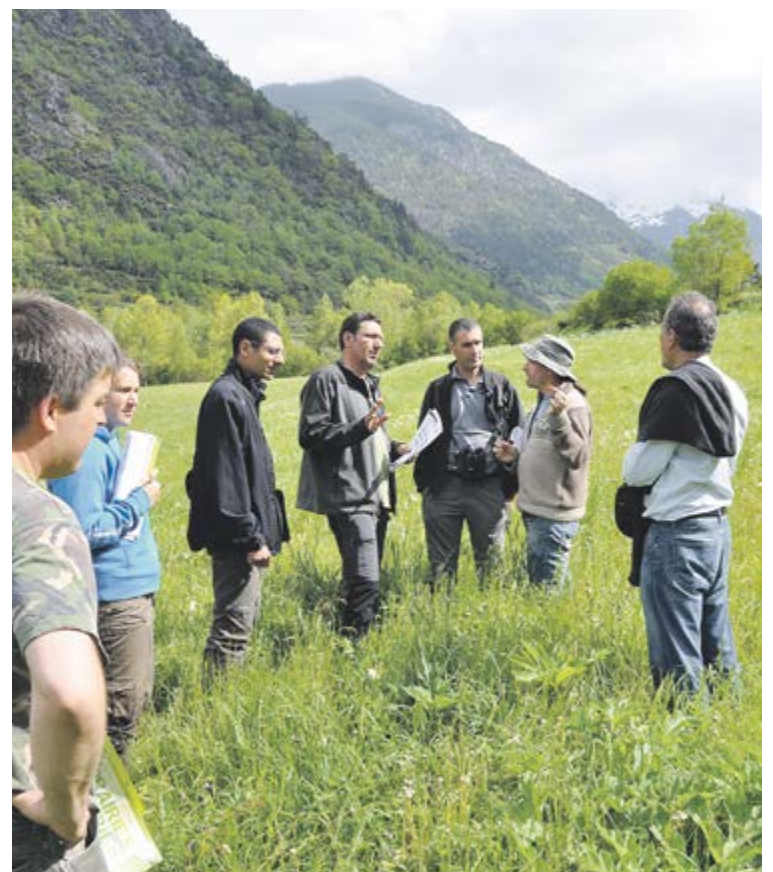
Vistes de la vall d'Ordino des d'un dels prats de dall de Cal Cametes (esquerra). El ramader, en primer terme, i els tècnics deliberen sobre el terreny proposat (dreta).

Un jurat format per experts botànics, agrònoms i ecòlegs de l'Arieja ha seleccionat la finca agrícola explotada per Cal Cametes, a Arans, per formar part del 4t Concurs agrícola dels prats florits que s'organitza a França per incentivar les bones pràctiques agrícoles i valorar l'equilibri ecològic dels prats. La representació andorrana anirà