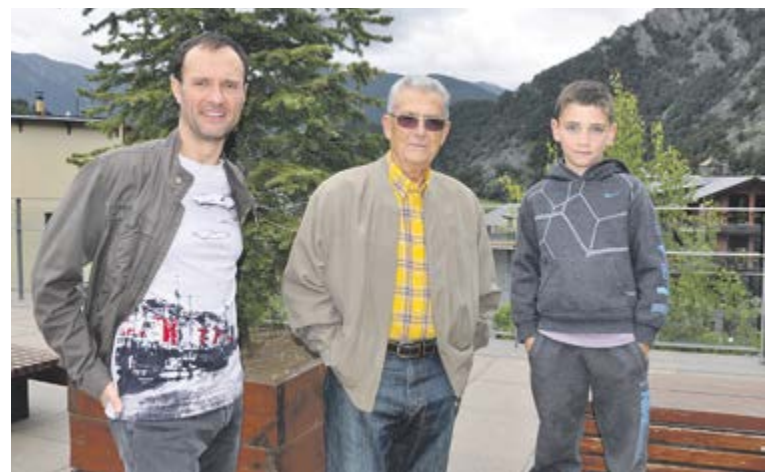
A la família Calvo són tres generacions que participen a l'AUTV.

ça satisfet del temps assolit, si més no d'haver-la acabat. «Aquest any hem tingut unes condicions excepcionals, ha estat una Mític inèdita, amb els canvis d'última hora», explica. «La 5a edició ha donat un salt qualitatiu quant a millora de l'assistència, els avituallaments i la feina dels voluntaris», assegura l'andorrà, que treballa a Sant Eloi, una de les empreses patrocinadores de la cursa.