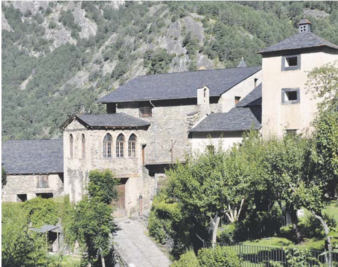
Vistes des de la biblioteca al conjunt arquitectònic de Casa Rossell, al bell mig del poble d'Ordino.

Les paradoxes de la vida van voler que una de les cases particulars més importants d'Ordino i del Principat d'Andorra, la Casa Rossell, acabés en mans de l'Estat. Després que quedés buida l'any 1993 sense cap hereu ni testament, el deteriorament de la casa pairal de la família De Riba ha estat progressiu fins arribar a ser visible a la part exterior els últims temps. Finalment, el Govern podrà destinar 388.000 euros del pressupost de Cultura a fer les intervencions necessàries a les parets i el teulat de la casa, a més de condicionar l'era i els jardins que l'envolten, actualment tancats al públic. Així ho va explicar in situ el ministre de Cultura, Albert Esteve, acompanyat del cap de Govern, Toni Martí, i el cònsol major, Ventura Espot. La rehabilitació de l'edifici, catalogat per Patrimoni cultural com a Bé d'interès cul-