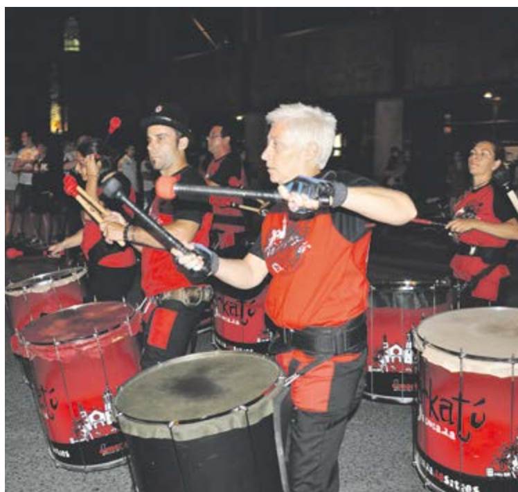
Imatge de la batucada de la festa del Roser.

Les expectatives de les festes del Roser d'Ordino eren altes, com cada any, però enguany hi havia un repte a assolir: endolcir l'agredolç amb què els veïns van acomiadar l'any passat la festa més sonada de la parròquia. El Comú ha pres mesures conjuntament amb la comissió de festes, i en roda de premsa va donar a conèixer l'operativa que es desplegaria en aquesta celebració al carrer, tret de sortida per a la resta de festes majors del Principat, que se celebra el primer cap de setmana de juliol. L'increment d'efectius