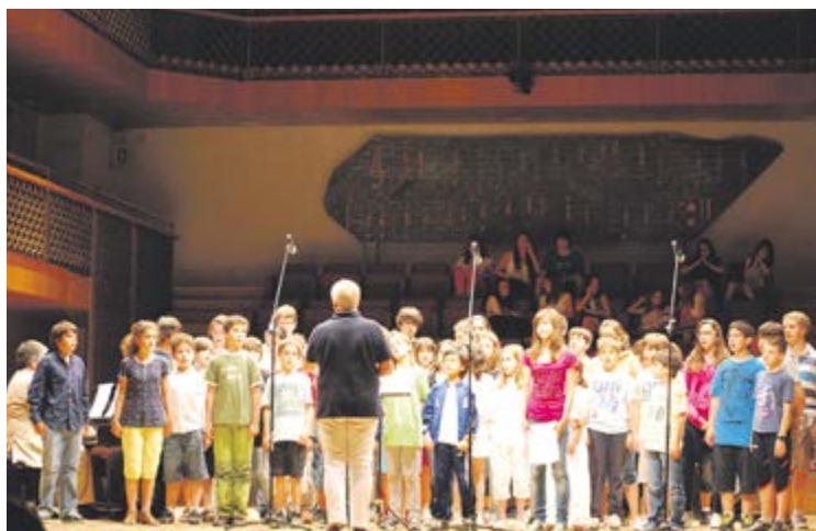
Alumnes de l'Escola de Música en una audició.

Centre Esportiu d'Ordino, que ofereixen classes durant tot el curs escolar, i els contactes de la ludoescola, la biblioteca i el Punt d'Informació Juvenil, equipaments culturals de referència. La majoria d'activitats que presenta la guia es desenvolupen a Ordino, llevat de l'Esbart, l'Escola de Música i l'Escola d'Art, que es desdoblen oferint classes també a la Massana. Aquestes últimes, coordinades conjuntament per les Valls del Nord, estan pensades per als residents de totes dues parròquies. Com a novetat, enguany