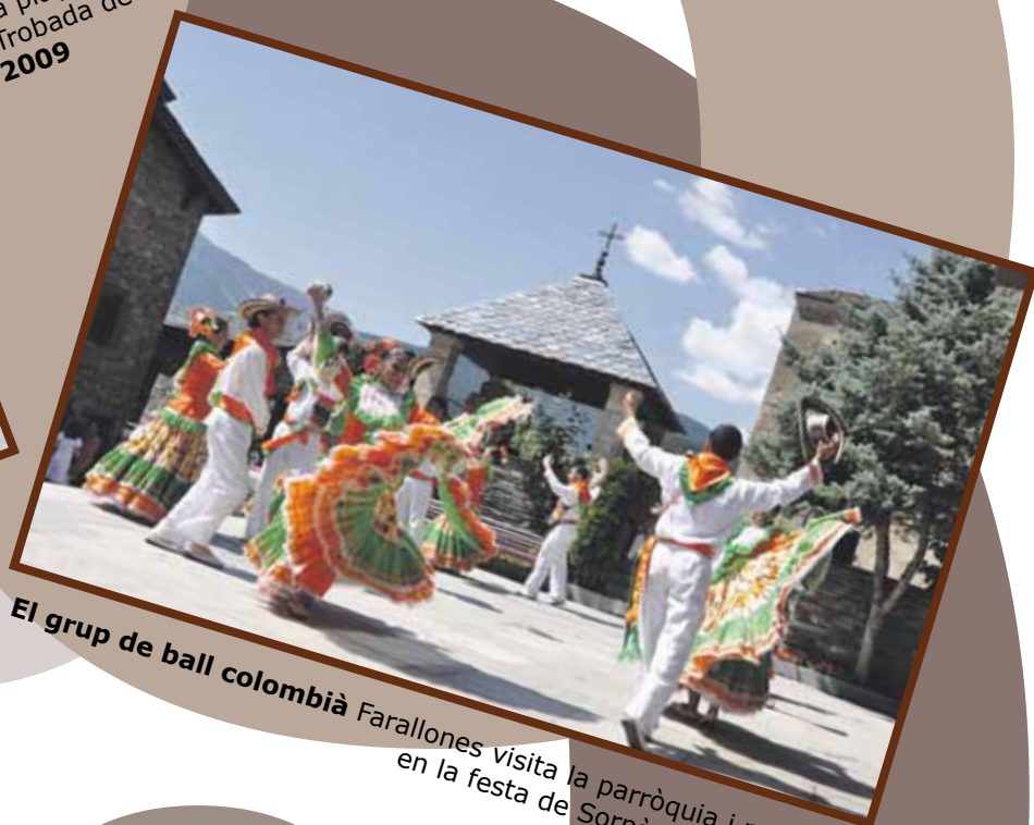
El grup de ball colombià Farallones visita la parròquia i participa en la festa de Sornàs. Agost 2009