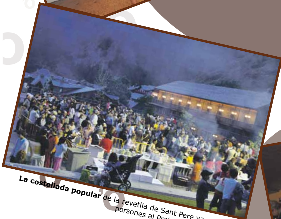
La costellada popular de la revetlla de Sant Pere va reunir 300 persones al Prat de Call. Juny 2009