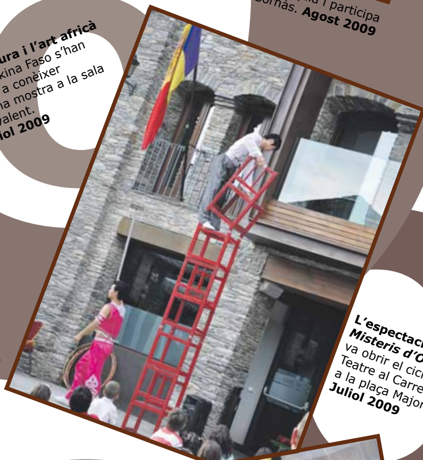
L'espectacle Misteris d'Orient va obrir el cicle Teatre al Carrer a la plaça Major. Juliol 2009