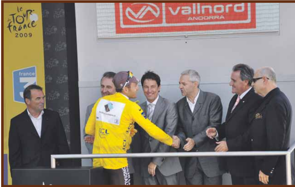
Rinaldo Nocentini, líder a la general, saluda les autoritats andorranes a l'arribada a Arcalís.

Les valls del nord van concentrar tota l'atenció en la primera etapa de muntanya del Tour, Andorra Arcalís. Si bé, segons els experts, encara era massa d'hora perquè l'escalada fos decisiva per a la puntuació de la cursa, en cap moment no va deixar de fer vibrar l'afició. Les autoritats, acompanyades pel director del Tour, Christian Prudhomme, es desplaçaven a la meta a les dues de la tarda en autobús per rebre i condecorar el guanyador de l'etapa, Brice Feillu, que va salvar els 900 metres de desnivell d'Ordino a la Coma d'Arcalís.