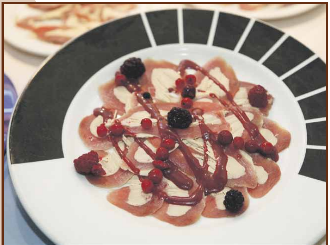
Un dels plats que es podran degustar a la Mostra Gastronòmica.

La cita culinària de tardor arriba a la majoria d'edat el 20 de setembre a l'Andorra Congrés Centre (ACCO).