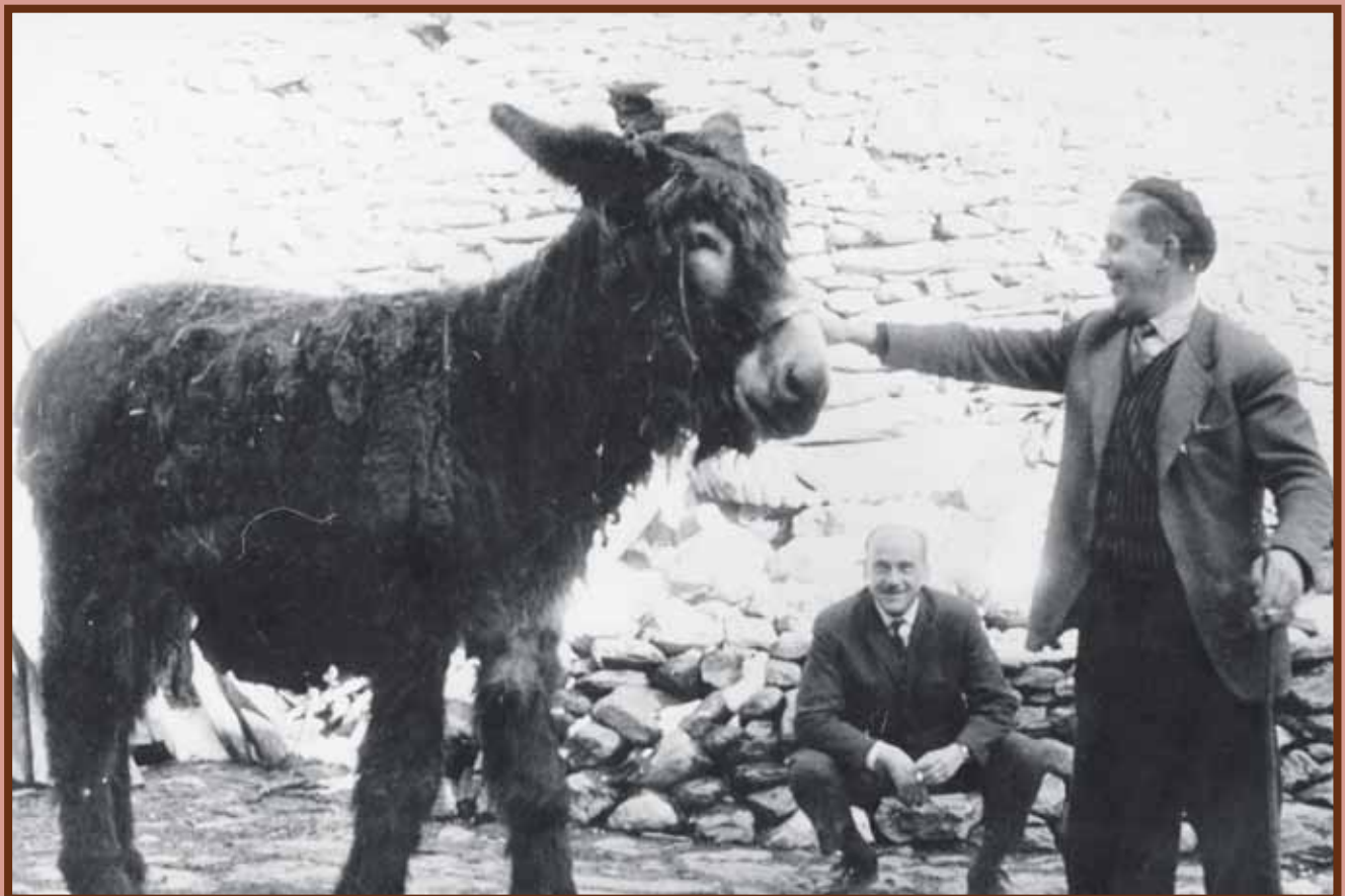
Un veí d'Ordino agosarat fa la guitza a la ruca mentre un altre contempla l'escena.

La temàtica és lliure, però hauran de ser imatges captades a Ordino i que s'identifiquin amb la història i la cultura de la parròquia, actuals o antigues. Podeu enviar-nos el vostre plat favorit, l'hort que us faci més goig o la porta que més us agradi. El concurs tindrà dues categories, infantil i adulta, i es podran presentar un màxim de dues fotografies per concursant. Les imatges s'han d'enviar a l'adreça electrònica: suggeriments@ordino.ad, i hi hauréu d'indicar el vostre nom i cognoms, l'edat i un telèfon de contacte. El guanyador veurà la seva foto publicada en el pròxim número i podrà escollir des d'entrades gratuïtes per als espectacles de la parròquia fins a una matrícula per als cursets de l'Escola d'Art.