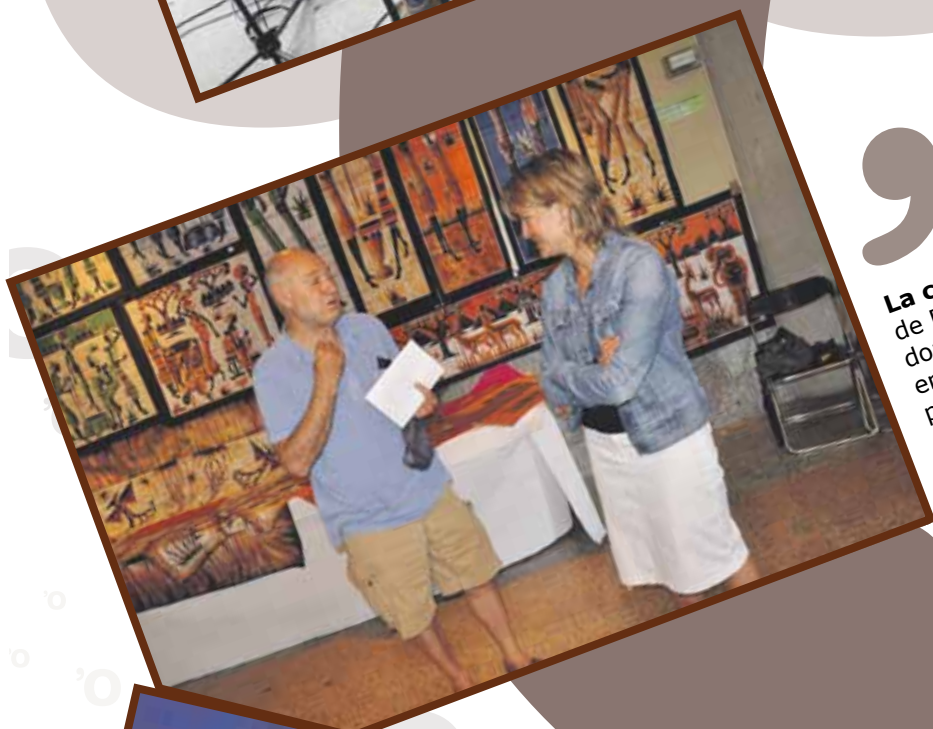
La cultura i l'art africà de Burkina Faso s'han donat a conèixer en una mostra a la sala polivalent. Juliol 2009