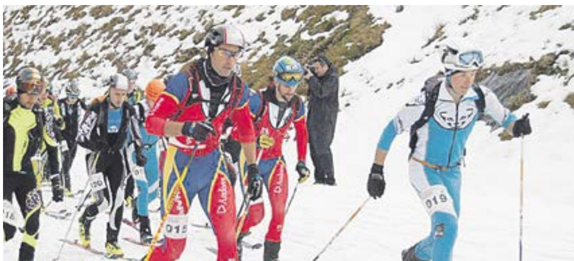
Un moment de la cursa organitzada per l'ECOJA que va obrir el calendari de la temporada.

L'Esquí Club Ordino-Arcalís (ECOJA) comença la temporada al calendari de la Federació Andorrana de Muntanya (FAM) amb l'organització de la primera cursa d'esquí de muntanya de la temporada 2015, el 23 de novembre, que puntuarà per a la Copa d'Andorra i portarà com a nom «Tomba la Coma». Pel que fa al club, enguany arrenca la temporada amb 208 inscrits, 195 en estil alpí i 13 en la modalitat de surf de neu. La novetat d'enguany serà la introducció a l'esquí de muntanya, amb la intenció d'arribar a formar un grup propi d'aquí a dos anys, en