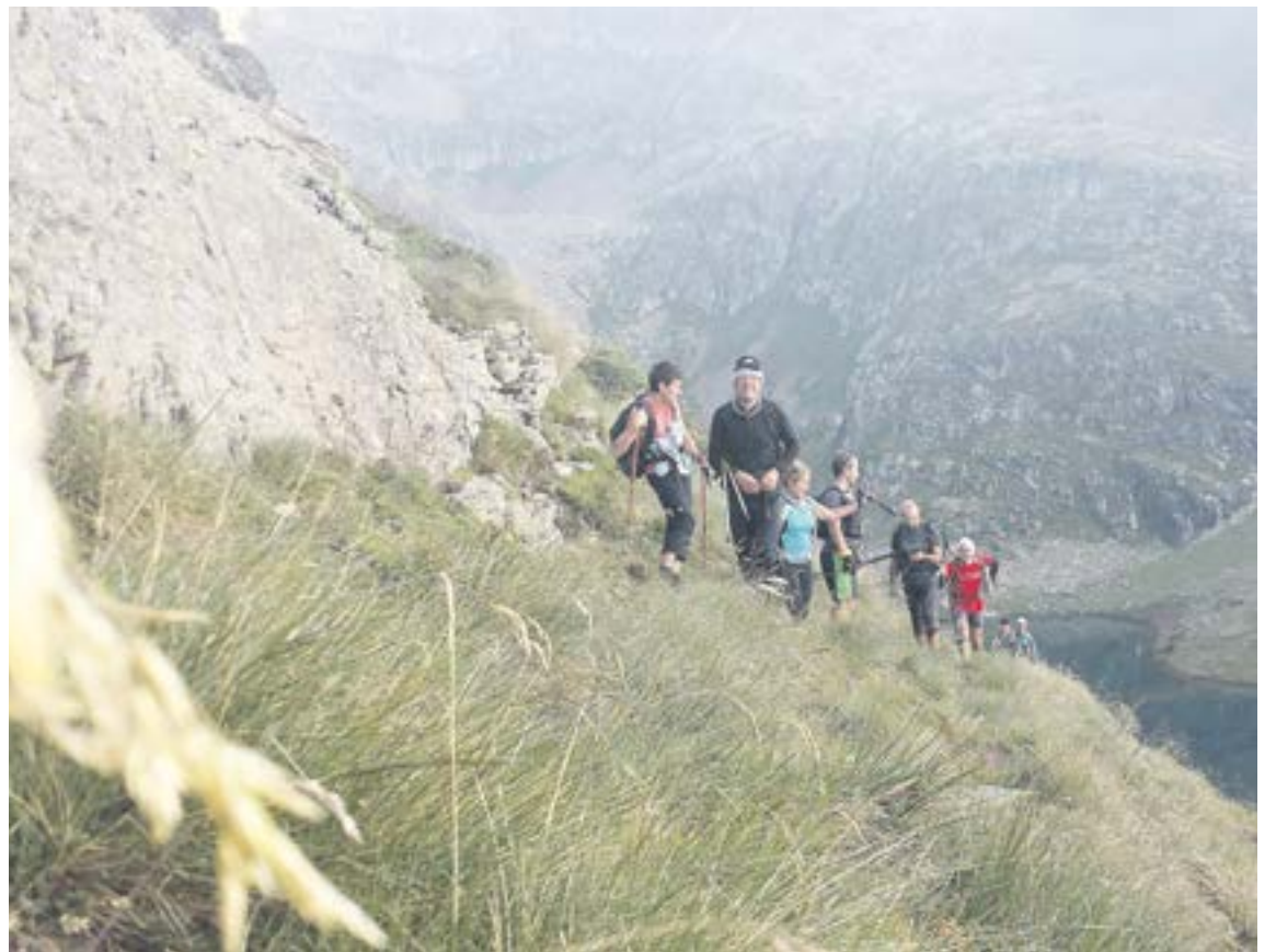
Participants de la primera experiència d'Explora Cims.

recollida i arribada amb transport privat de l'organització, per als turistes, és clar, ja que els residents també poden aventurar-se i allotjar-se al seu domicili. La recollida també es fa en cas que algú vulgui abandonar o escurçar el tram. Els àpats del dia s'organitzen amb un pícnic en una petita motxilla i un avituallament complet en un refugi. Unes deu persones es van estrenar en el circuit dels cims l'última setmana d'agost. «El 2015 oferirem més flexibilitat, de manera que puguis fer dos o tres dies en lloc de tots set, i s'ampliarà a tres setmanes», avança. Entre els participants, bascos i catalans la majoria, destaca la tornada d'un corredor de la Ronda a l'AUTV que va voler repetir l'experiència en família i amb calma. Els guies inclouen en el recorregut l'explicació i la interpretació del terreny des del punt de vista geològic, i també de les espècies vegetals i animals autòctones.