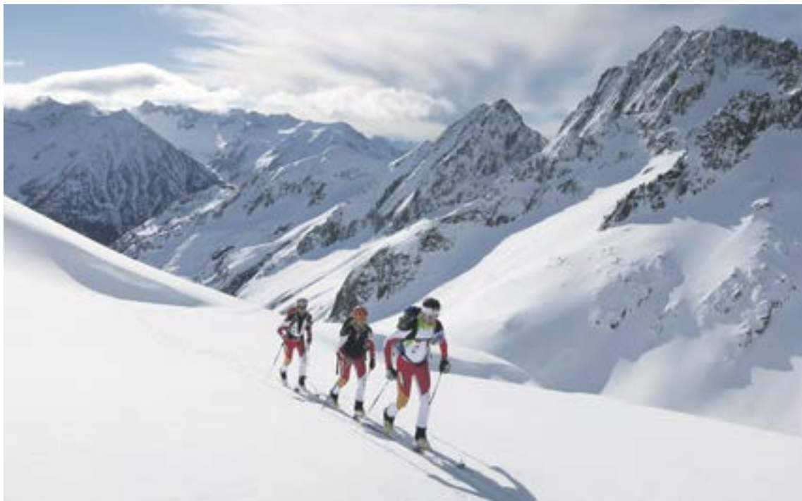
Fotograma de la primera projecció en què els protagonistes pugen el pic de Mulleres.