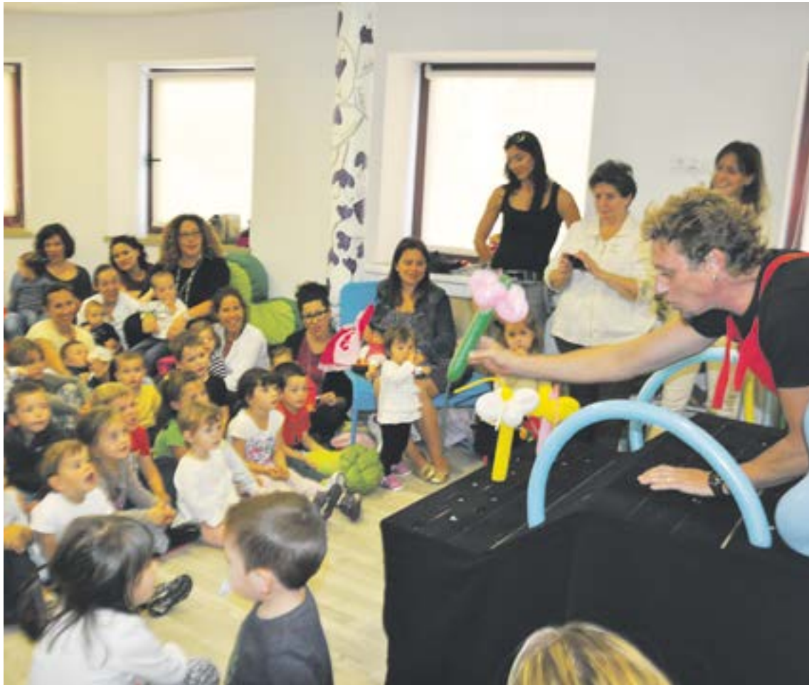
Els petits van estrenar les instal·lacions amb un espectacle amb globus.

La conselleria d'Educació ha creat la bebeteca, un nou espai per fomentar l'hàbit de la lectura entre els 0 i els 6 anys i compartir-la d'una manera lúdica amb els pares o tutors en un espai còmode, atractiu i pensat específicament per als primers lectors. L'equipament es va omplir de gom a gom el primer dia que es va obrir al públic, el 25 de setembre, dia en què es va programar un espectacle de globoflèxia. La iniciativa dona resposta a un ampli sector de la població, ja que Ordino té la demografia més jove d'Andorra; dins d'aquesta franja d'edat concretament hi ha 458 habitants censats. «Només existeix un espai de característiques i objectius similars al Pas de la Casa, i hem pensat que valia la pena fer una petita inversió de la qual es podran veure els fruits més endavant», ha argumentat la consellera Gemma Riba, responsable de la política d'Educació, Joventut i Cultura. La sala, ubicada al segon pis de l'edifici La Font, estarà custodiada per la biblioteca comunal, tot i que no a les mateixes de-