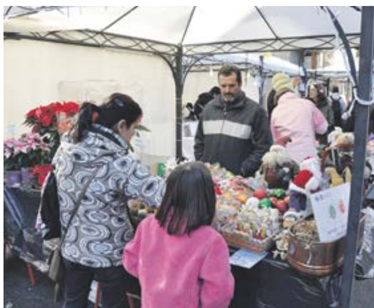
La Fira de Nadal es muntarà els dies 6 i 7 de desembre.

La canalla i el públic familiar seran els protagonistes del programa de festes que s'ha elaborat conjuntament entre les conselleries de Cultura i Turisme, amb algunes novetats. La proposta d'una sortida al vespre, amb lluna plena, per anar al bosc a buscar el tió és una de les activitats dissenyades per al públic familiar més esperades. La canalla també tindrà animacions de globoflèxia i bombolles de sabó el cap de setmana del 6 i 7 de desembre, en el marc de la Fira de Nadal, que es tornarà a instal·lar a la plaça Major. La Fira tindrà com a expositors comerciants i creatius d'artesania tèxtils, bijuteria, ornaments de Nadal, etc. Com a incentiu per als visitants, aquells que facin una compra superior a cinc euros podran participar en una rifa que tindrà lloc el diu-