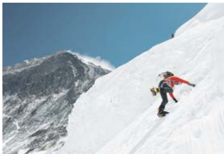
L'alpinista Ueli Steck en una ascensió a l'Everest.

col·laboració amb Multisegur Assegurances, la Comissió Nacional Andorrana per la Unesco, Carving Esports i el Govern d'Andorra. En el documental veurem la increïble ascensió a la cara sud de l'Annapurna, una de les muntanyes més difícils del món. Steck va presentar la seva aventura el gener d'aquest any a la Royal Geographical Society de Londres com un dels èxits més impressionants de la història de l'alpinisme. El públic podrà compartir amb el protagonista la seva experiència i acostar-se a aquests i altres nous reptes.