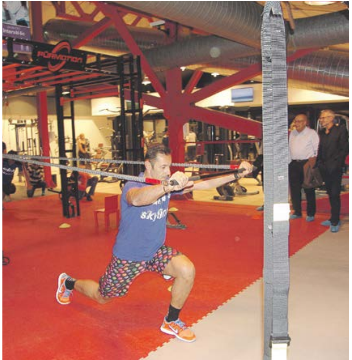
A dalt, moment de la col·locació de la caldera de biomassa, instal·lada al subsòl de l'aparcament vertical del CEO. A baix, la piscina amb la nova graderia i la il·luminació de leds, el dia de la presentació a les autoritats. A la dreta, en primer pla, el ciclista Cedric Gracia entrena a la Purmotion en la nova sala de fitnes.