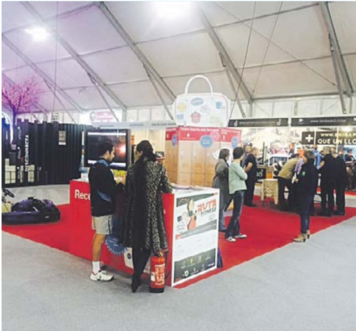
Aspecte de l'estand que els centres esportius comunals van presentar a la Fira d'Andorra la Vella.

l'esport. Els set comuns han programat un cicle de xerrades, conjuntament amb el Col·legi de Dietistes i Nutricionistes d'Andorra, obertes a tothom i gratuïtes. Els socis de qualsevol dels set equipaments esportius comunals que organitzen l'activitat tindran, a més, un 50% de descompte en una visita a la consulta dels professionals col·