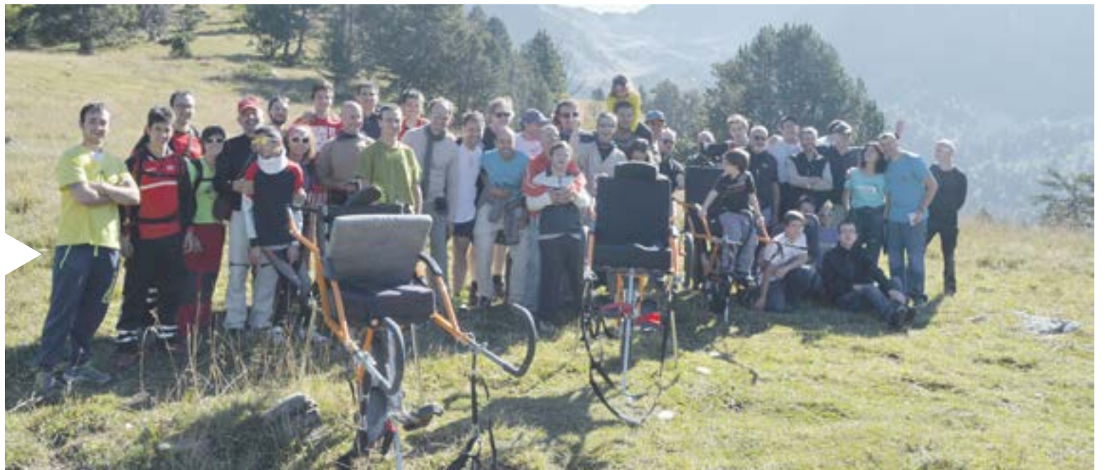
HI ARRIBAREM L'equip de Medi Ambient va donar a conèixer la vall de Sorteny i la Coma del Forat a un grup de setanta persones de l'associació Hi arribarem.