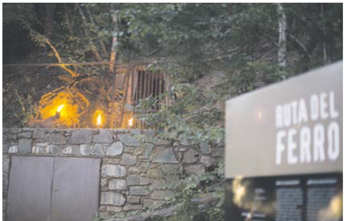
Visió nocturna de l'entrada de la Mina de Llorts, un dels equipaments més visitats.

visites nocturnes per complementar l'oferta existent. També ha atret molt públic aquesta temporada la mola i la serradora de Cal Pal, al poble de la Cortinada, que ha rebut 737 visites, un increment destacable respecte de les 183 del 2013. Pel que fa a les visites diürnes, la tendència també és positiva amb 3.310 visitants el 2014 respecte als 2.770 del 2013. Un altre servei turístic que s'ha posat en marxa enguany a la parròquia ha estat el de guies de muntanya, fruit de la col·laboració entre el sector privat, l'hoteler i les empreses de guies turístiques, i el Comú. Fins a 265 persones, 85 al juliol i 180 a l'agost, l'han utilitzat. El servei personalitzat de guia, a la carta, es podia contractar directament als hotels on s'allotjaven els turistes o a l'Oficina de Turisme.