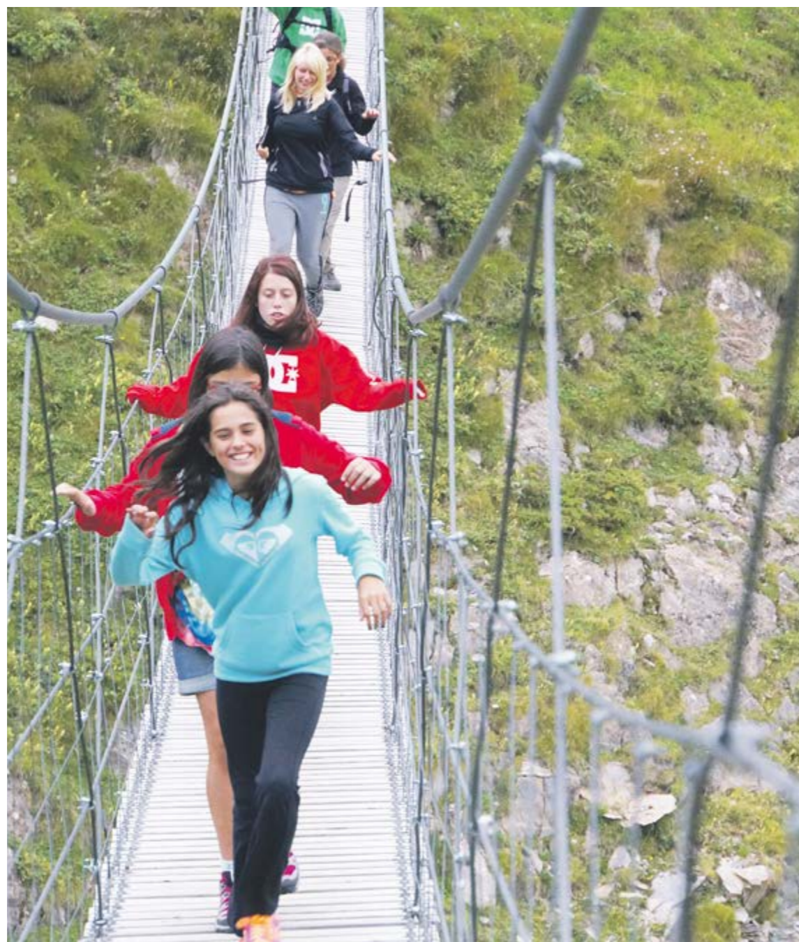
Els joves en un pont de mico al bosc d'aventura d'Encamp durant les colònies d'estiu, a l'agost.

Ja estan obertes les inscripcions per al casal d'estiu, un servei comunal adreçat als escolars de la parròquia d'entre 3 i 12 anys en període de vacances. Enguany, amb el lema «Enganxa't a l'estiu», es proposen un munt d'activitats lúdiques i esportives que s'adapten a totes les edats. A més de les sortides i excursions de dia, al Casal es promouen altres aptituds com la creativitat dels infants a través dels tallers de pintura i de manualitats. L'1 de juny també s'obre el període d'inscripció per a les colònies d'estiu, que es faran del 23 al 29 d'agost als Cortals d'Encamp amb el tema «Meravellosa Índia». Els escolars d'entre 9 i 14 anys es podran apuntar del 13 al 17 de juliol a la segona edició del taller de robòtica, després de la que es va fer per les vacances de Pentecosta. El seminari es torna a fer a la sala La Buna, en horari de matins, de 9 a 13 h. Durant les vacances d'estiu, els més grans de 10 anys poden participar també en les activitats gratuïtes que ofereix el Punt d'Informació Juvenil per setmanes, per a les quals es necessita inscripció prèvia.