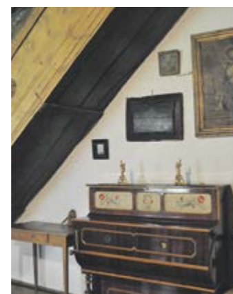
Casa Museu d'Areny-Plandolit.