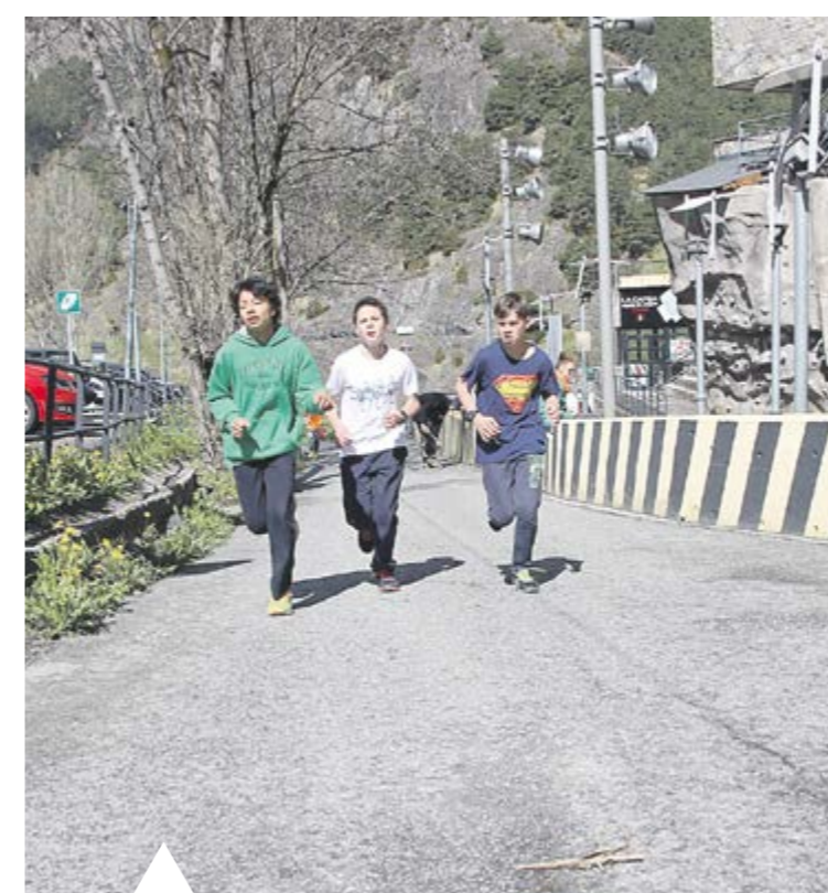
CURSA CONTRA LA FAM Els alumnes de l'Escola andorrana de 2a Ensenyança d'Ordino han participat en dues curses, l'última el dia 22 de maig, amb fins solidaris.