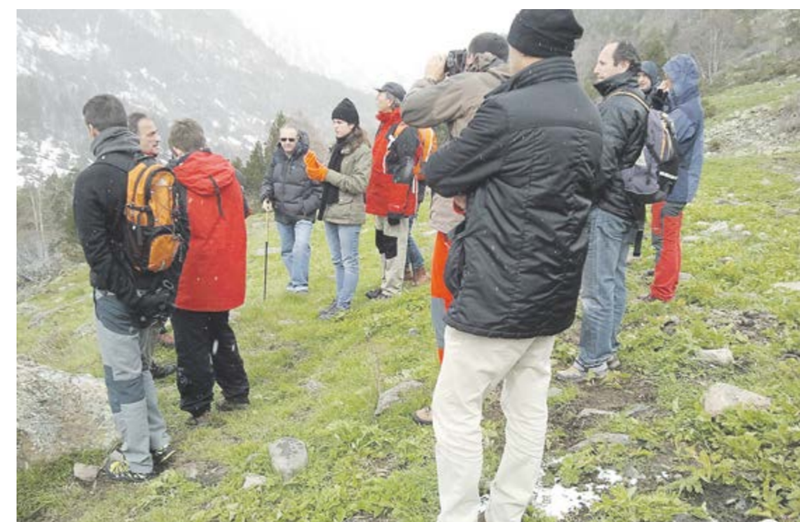
Sorteny també va acollir la sortida del 2013, que es va fer amb fred i neu.

Una de les principals missions a l'hora de gestionar els parcs naturals, a més de la seva protecció, és difondre la importància i els valors intrínsecs d'aquests espais. El Parc Natural Comunal de les Valls del Comapedrosa i el Parc Natural de la Vall de Sorteny conformen un patrimoni natural únic a les Valls del Nord. Els últims anys, la política mediambiental s'ha preocupat de descobrir aquest patrimoni als ciutadans. S'organitzen moltes accions i activitats al voltant dels dos parcs, però sens dub-