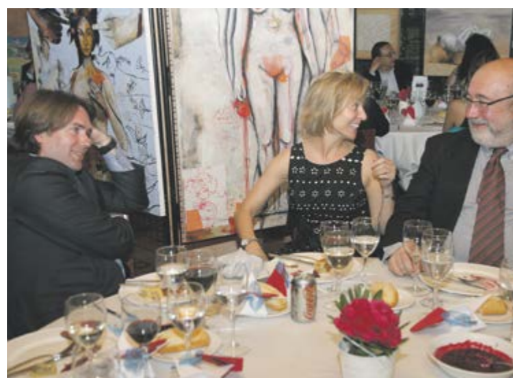
El primer sopar subhasta va tenir lloc a l'Hotel Coma.

La Capsa, espais de creació celebrarà una segona edició de la subhasta benèfica d'art, que enguany tindrà lloc al restaurant Molí dels Fanals, a Sispony. El 50% de la recaptació de les vendes de la subhasta, que es farà el dimecres 10 de juny a les 8 del vespre, es destinarà a l'Escola Especialitzada Nostra Senyora de Meritxell (EENSM), mentre que l'any passat es va atorgar a la Fundació Privada Tutelar. L'esdeveniment, igual que en l'última edició, tindrà un format sopar, a un preu de 50 euros, al qual podrà assistir tothom que ho vulgui, després d'adquirir el tiquet a les oficines