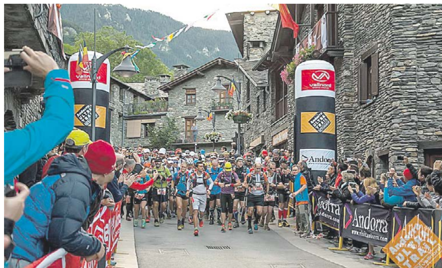
Tret de sortida de la Ronda dels Cims el 7 de juliol de 2014.

Ordino acollirà 2.500 corredors entre el 25 i el 28 de juny a les cinc proves de l'Andorra Ultra Trail Vallnord, un esdeveniment que cada any aconsegueix superar-se, en tots els aspectes, amb cinc proves diferents. La Marató dels Cims (42,5 km, 3.000 m D+) torna a ser un èxit després de l'acceptació que va tenir l'any passat, i enguany tindrà 750 corredors. Juntament amb la Ronda dels Cims (170 km, 13.500 m D+), la prova reina que ha repartit 400 dorsals, han estat les primeres curses a tancar les inscripcions del 2015. A aquestes dues proves les seguiran la Mítica (112 km, 9.700 m D+), la Celestrail (83 km, 5.000 m D+) i la marxa popular Solidaritrail (10 km, 750 m D+). No cal dir que Ordino hi tindrà un paper protagonista, amb 50 residents inscrits (el 15 de