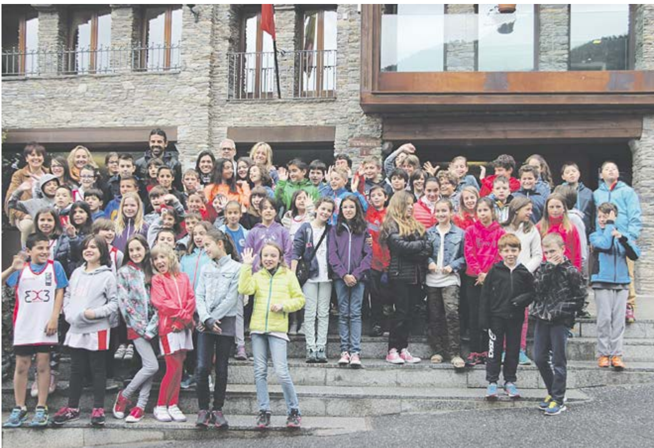
Foto de grup de l'últim Consell d'Infants del curs, en què es va aprovar la Mini Ultra Trail.