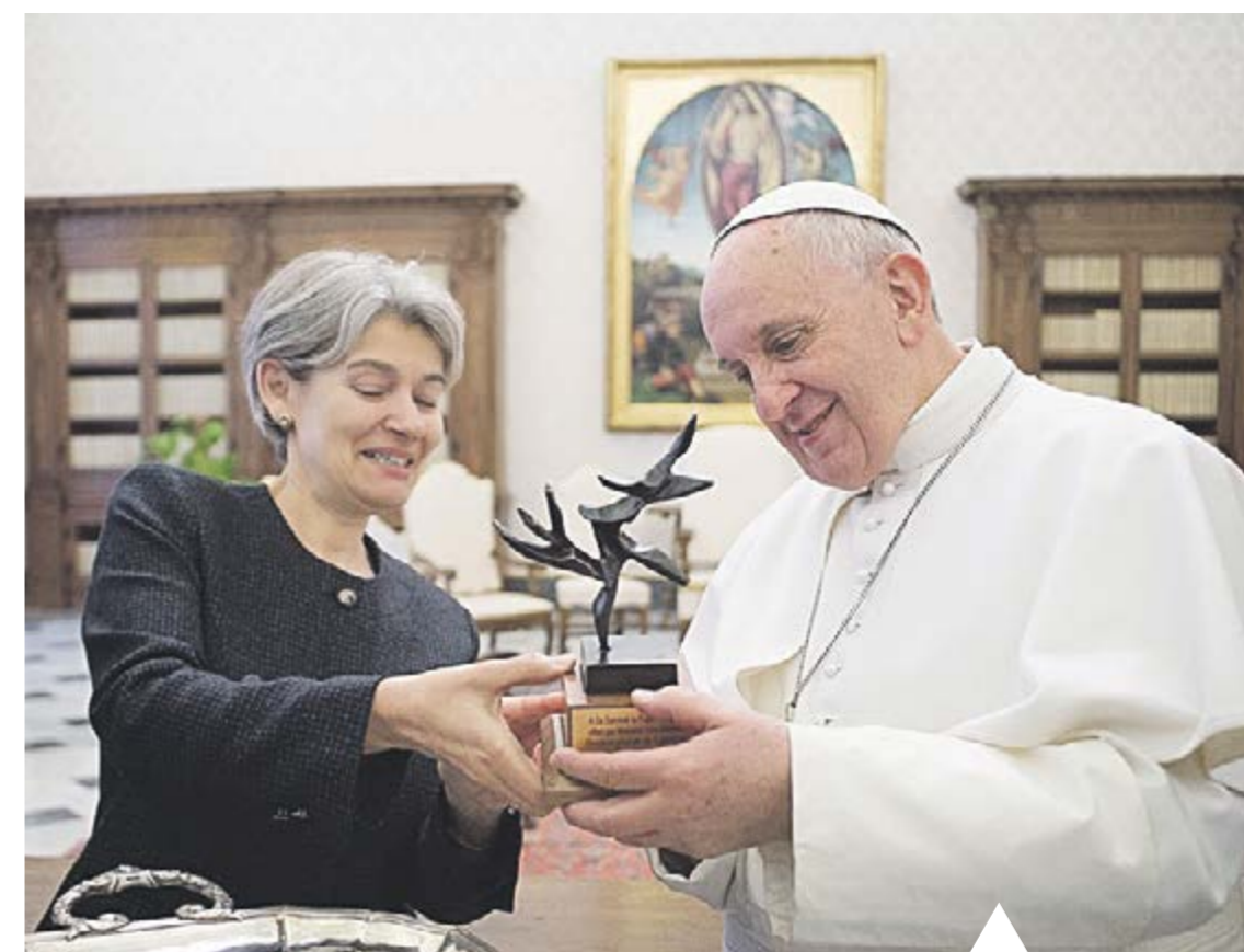
L'ARBRE DE LA PAU La directora general de la Unesco, Irina Bokova, va lliurar l'Arbre de la Pau, símbol d'Art Camp, al papa Francesc al Vaticà, el dia 2 de març.

EXPOSICIÓ DE BOTÀNICA L'exposició de plantes que organitza cada any la Societat de Micologia i Botànica de Catalunya Nord es farà el cap de setmana de l'11 i 12 de juliol al Centre de Natura de la Cortinada.