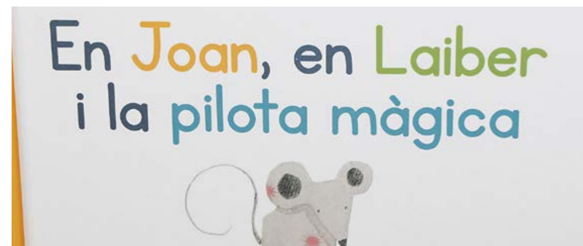
Imatge de la portada del llibre editat el 2015.