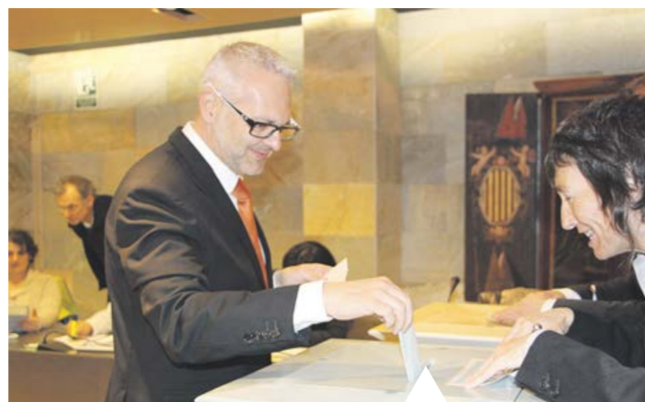
ELECCIONS GENERALS El cònsol major no va desapropiar l'ocasió per fer broma amb la cònsol menor en el moment del vot a les eleccions generals, el dia 1 de març.