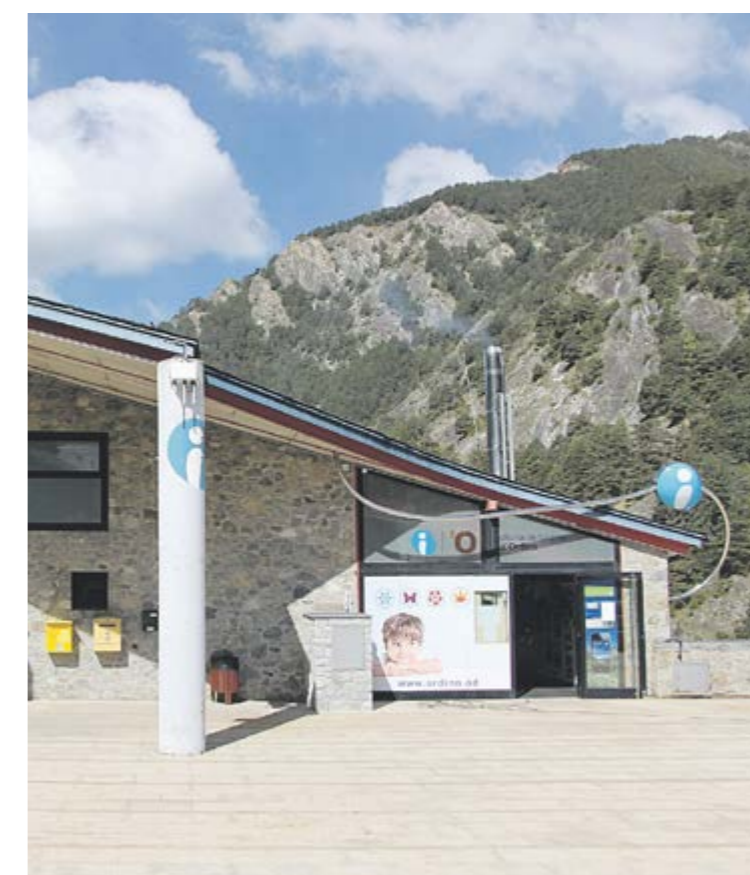
Exterior de l'Oficina de Turisme d'Ordino.