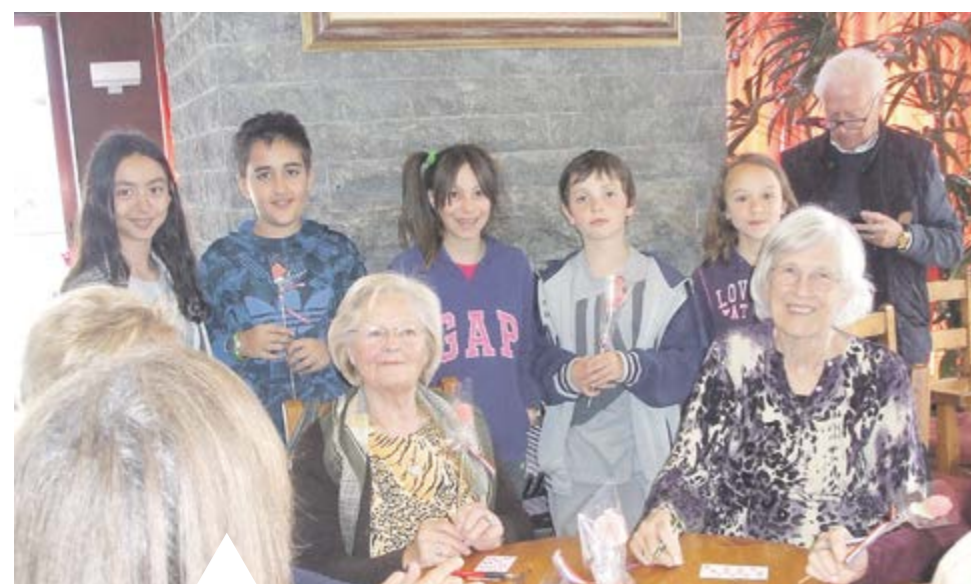
DIADA DE SANT JORDI Els joves del PIJ que van participar per Sant Jordi en el taller de roses fetes amb llaminadures les van oferir a les padrines de la Casa Piral.