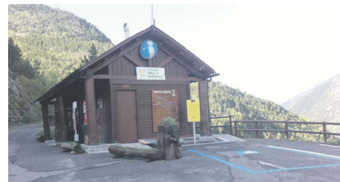
L'Oficina d'informació del Parc estarà oberta de l'15 de juny al 30 de setembre.

porta al refugi, des de l'aparcament a la Canya de la Rabassa, entre les 10 del matí i les 7 de la tarda, de l'1 de juny al 30 de setembre. L'oficina d'informació començarà la temporada el 15 de juny per oferir ajuda als visitants en tot allò que necessitin i estarà oberta fins al 13 de setembre. L'espai d'informació i benvinguda ofereix wifi gratuït, un telèfon i una màquina expenedora. Per als qui volen fer una visita lliure al Parc, es recomana primer anar al Centre de Natura de la Cortinada, un centre d'interpretació amb entrada lliure on s'explica com es van formar les valls i els principals hàbitats per reconèixer les espècies que trobarem al Parc.