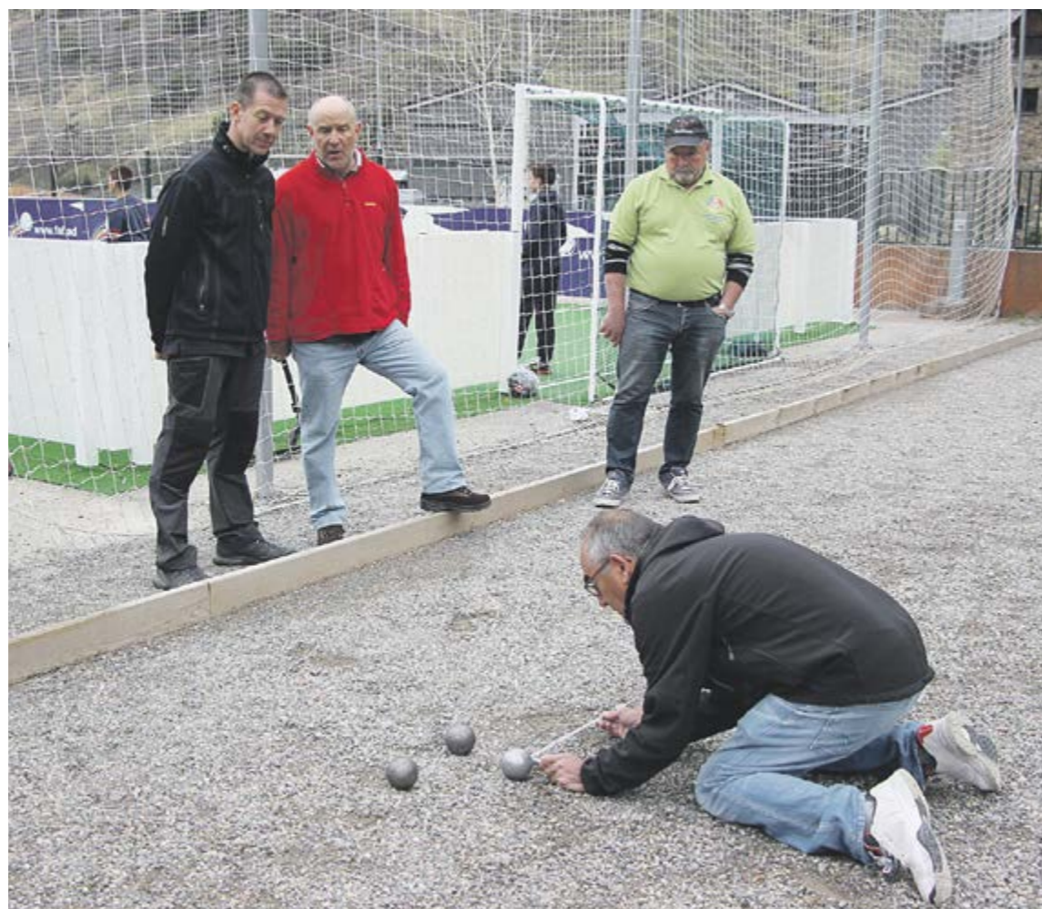
Los jugadors observen l'àrbitre en la comprovació d'una bola guanyadora al torneig celebrat al maig.

El CPO ha recuperat aquest esport de tradició francesa que