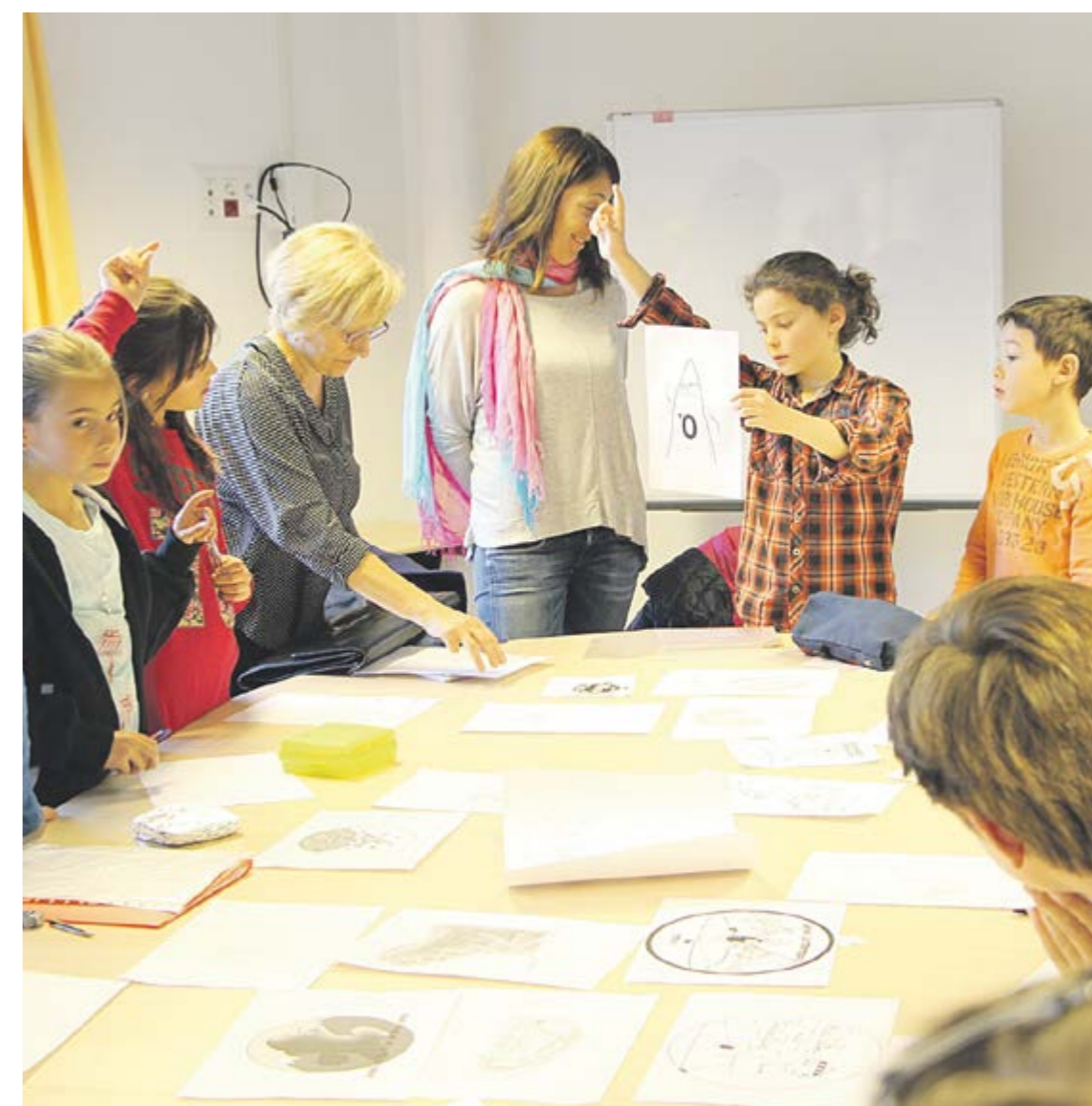
Taula de treball dels infants amb la consellera de Cultura, al centre, i la representant de Finances.

Els alumnes de primària d'Ordino veuran feta realitat una de les propostes que van plantejar a la sala del Consell a l'inici de curs, la realització d'una Mini Ultra Trail infantil. A la cursa, que tindrà lloc el 18 de juny, hi participaran 124 alumnes de segon i tercer cicle de Primera Ensenyança de l'Escola andorrana i 63 alumnes de les classes CE2, CM1 i CM2 del sistema francès. En total, 187 escolars d'entre 8 i 12 anys que es disputaran en dues categories segons la franja d'edat, de 8 a 10 i de 10 a 12 anys, sis podis masculins i sis de femens. La sortida serà a les 9.30 h de la plaça Major i l'arribada es preveu com a màxim dues hores més tard a Prat de Call. El recorregut, gairebé circular, portarà els infants a recórrer el camí del Bosc de l'Esquella, que enfilaran des del camí de Segudet, després s'endinsaran al bosc cap al Coll d'Ordino, i baixaran pel Coll i el camí de la costa del Pui fins a Prat de Call. «S'ha buscat un camí que sortís del poble i que tingués el consens de tothom; finalment, en-