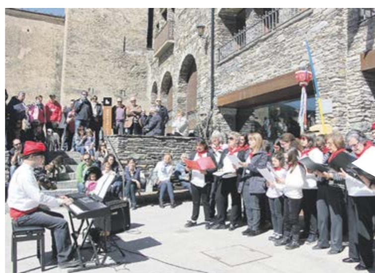
CARAMELLAIRES Els caramellaires van omplir els carrers i les places del poble d'Ordino el diumenge de Pasqua per cantar les Caramelles.