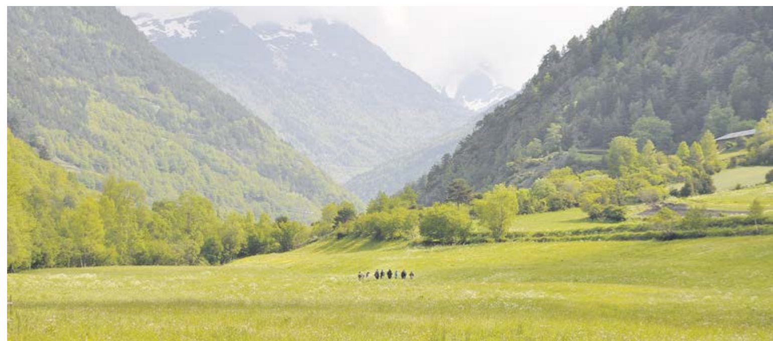
Panoràmica de la vall des del prat guanyador del Concurs de prats florits del 2013, a Arans.

El concepte de prats florits es basa en un mètode d'avaluació per valorar la biodiversitat dels prats naturals: l'observació de flors com a bioindicadors fàcils