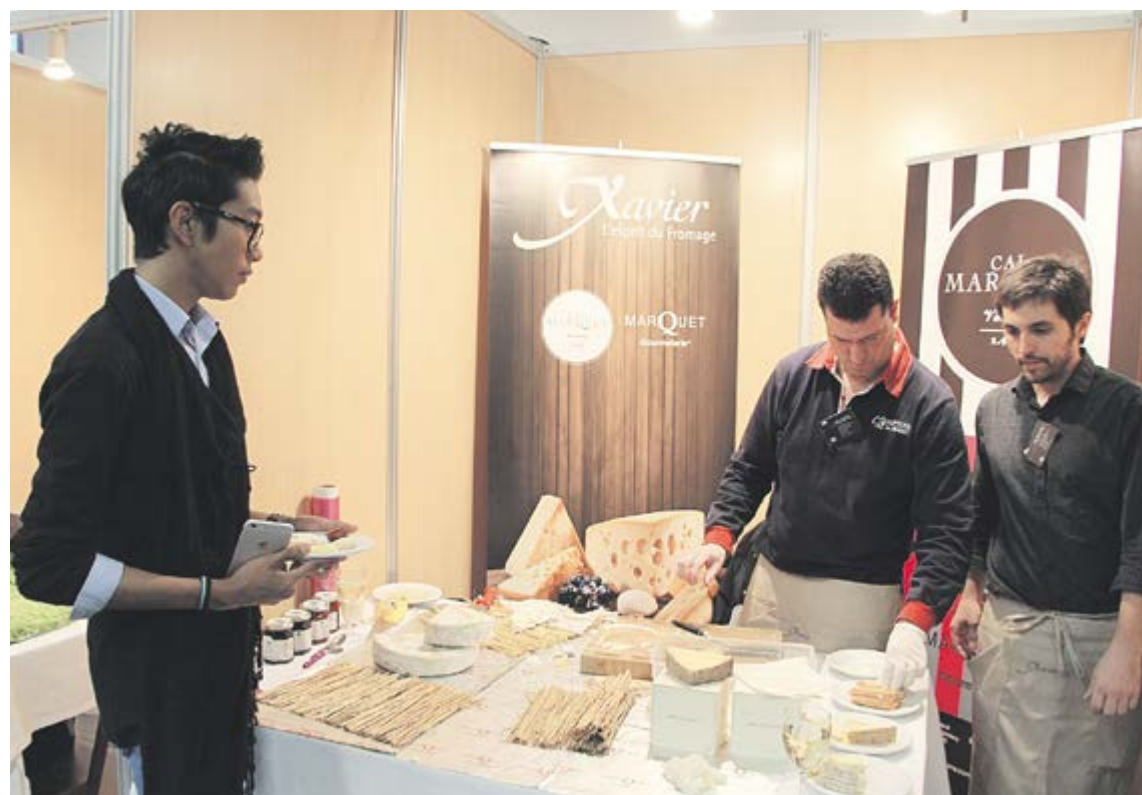
Un client de la Mostra espera una selecció de formatges a l'estand de Cal Marquet.

Quant als cellers, la cervesa Moritz i el vermut d'origen ga-