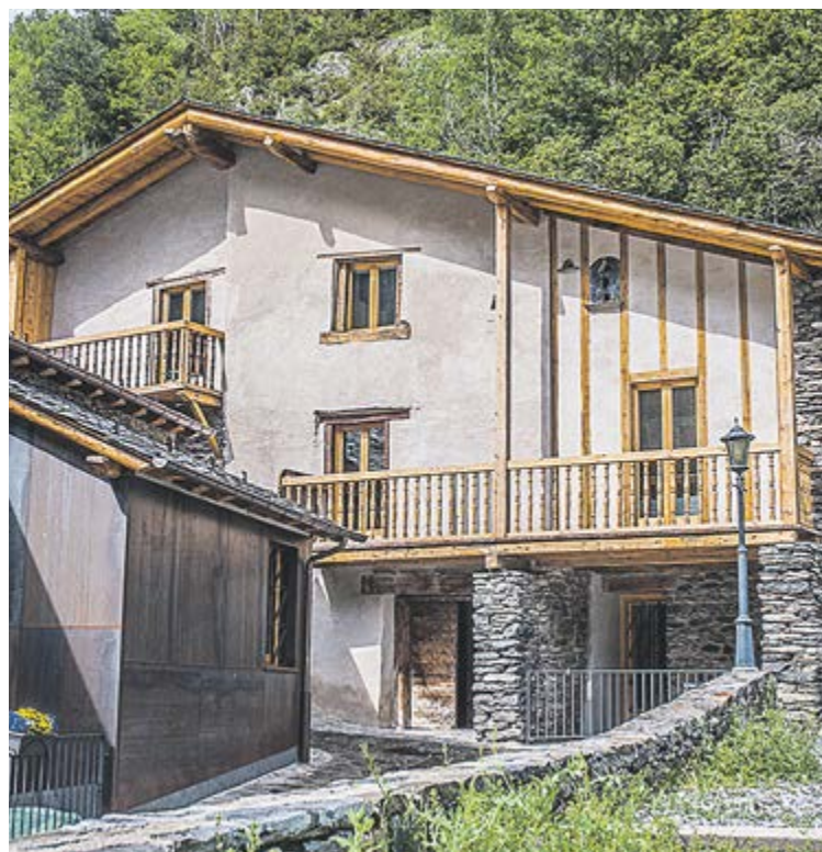
La façana principal conserva la balconada i les finestres originals.