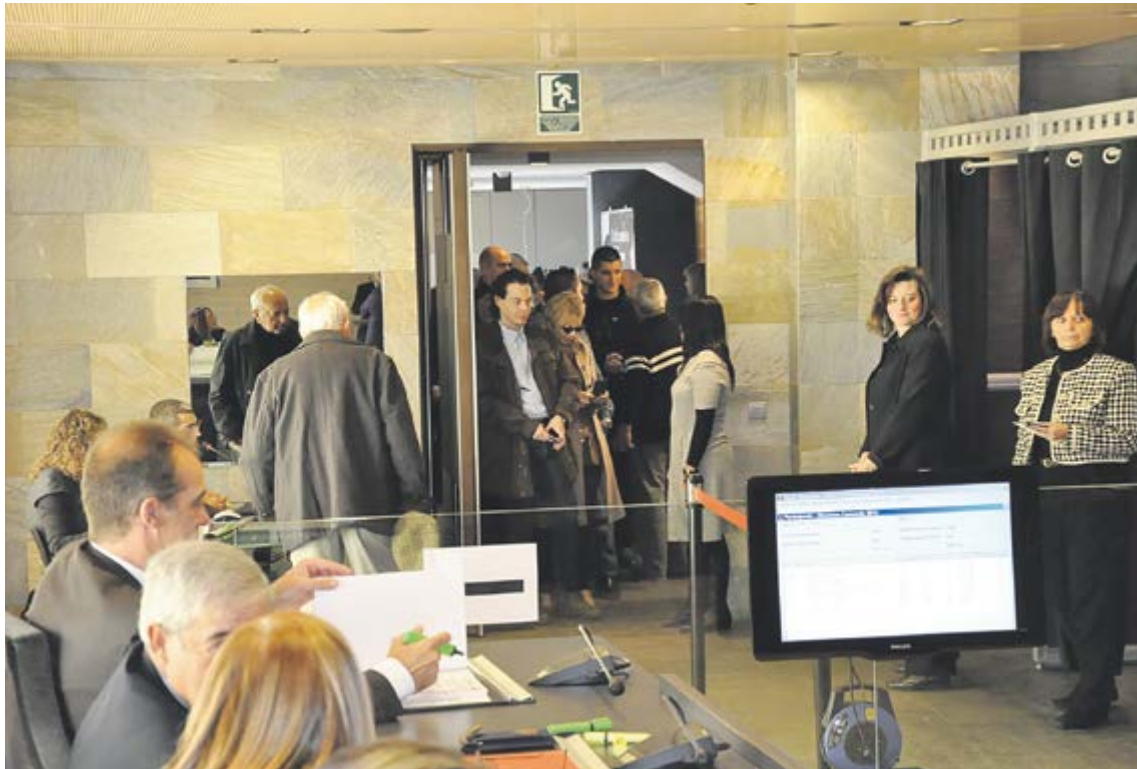
Un moment de la jornada electoral viscuda a les passades eleccions comunals del 2011.

El Comú ja ho té tot preparat per ser col·legi electoral de les