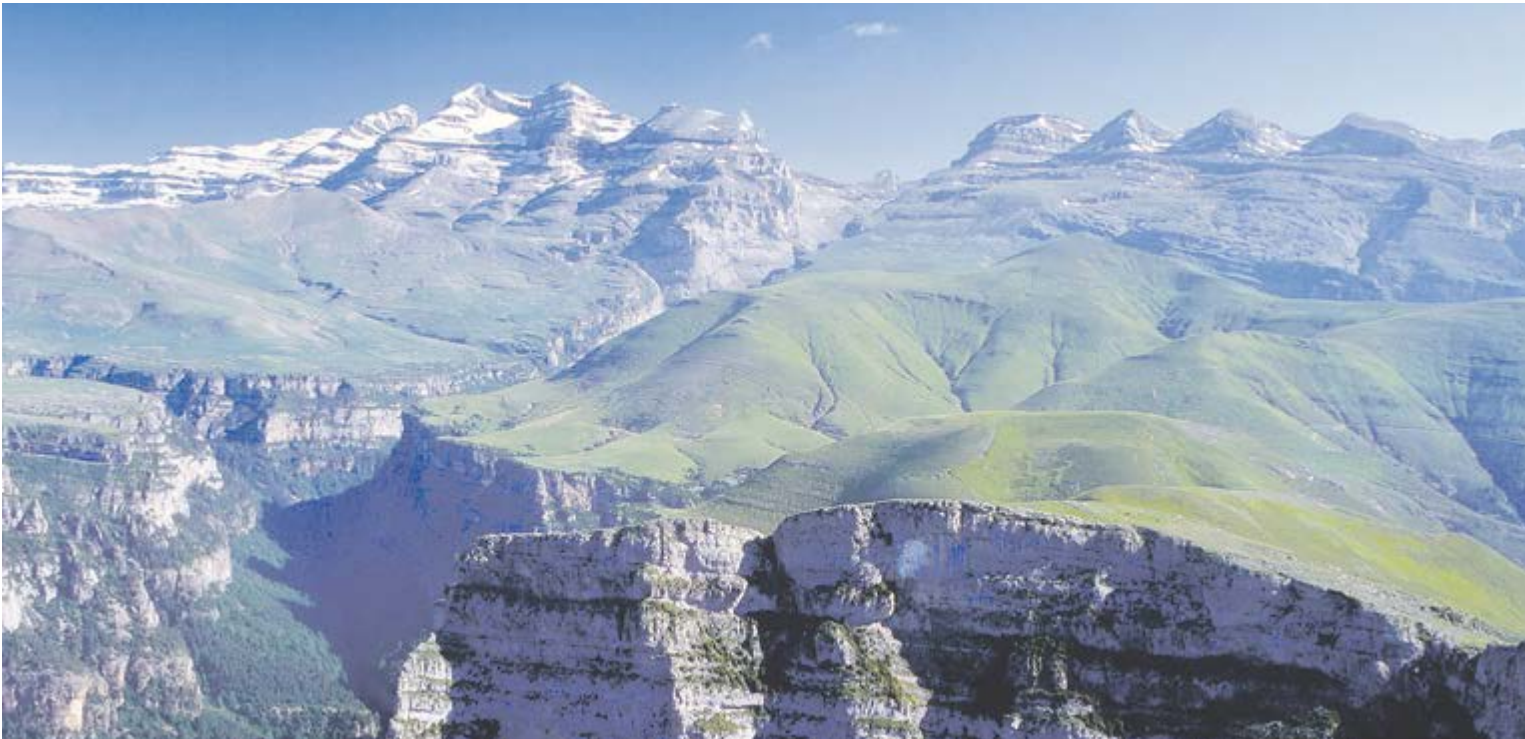
Espectacular panoràmica de Patrice de Bellefon del massís del Mont Perdut, a la vall d'Ordesa.

El guia de muntanya i escriptor francès Patrice de Bellefon (Tolosa, 1938) serà el convidat d'enguany per celebrar el Dia Internacional de les Muntanyes, el divendres 11 de desembre, a les 9 del vespre, a l'Auditori Nacional d'Andorra. L'acte consistirà