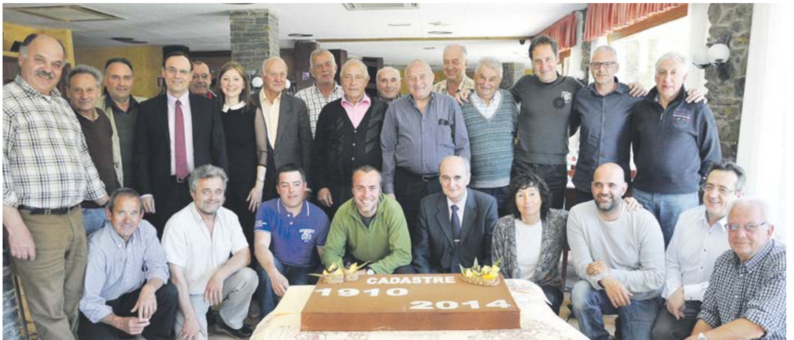
A dalt a l'esquerra, la façana renovada del CEO. A dalt a la dreta, la primera feixa del parc infantil de Prat de Call amb elements de joc per als més petits. A baix, foto de grup amb els veïns i els tècnics implicats en l'actualització del cadastre.

del terreny i representants dels quarts i dels diferents pobles, es van organitzar en comissions per treballar conjuntament amb els tècnics i l'administració. Gràcies a l'entesa, actualment hi ha un registre administratiu dels béns immobles de la parròquia que no sols facilitarà la gestió del territori en els àmbits jurídic i urbanístic, sinó també la gestió forestal i de pastures. El repte és anar actualitzant el registre, que es pot consultar en línia mitjançant la pàgina web d'Ordino. Posar concert