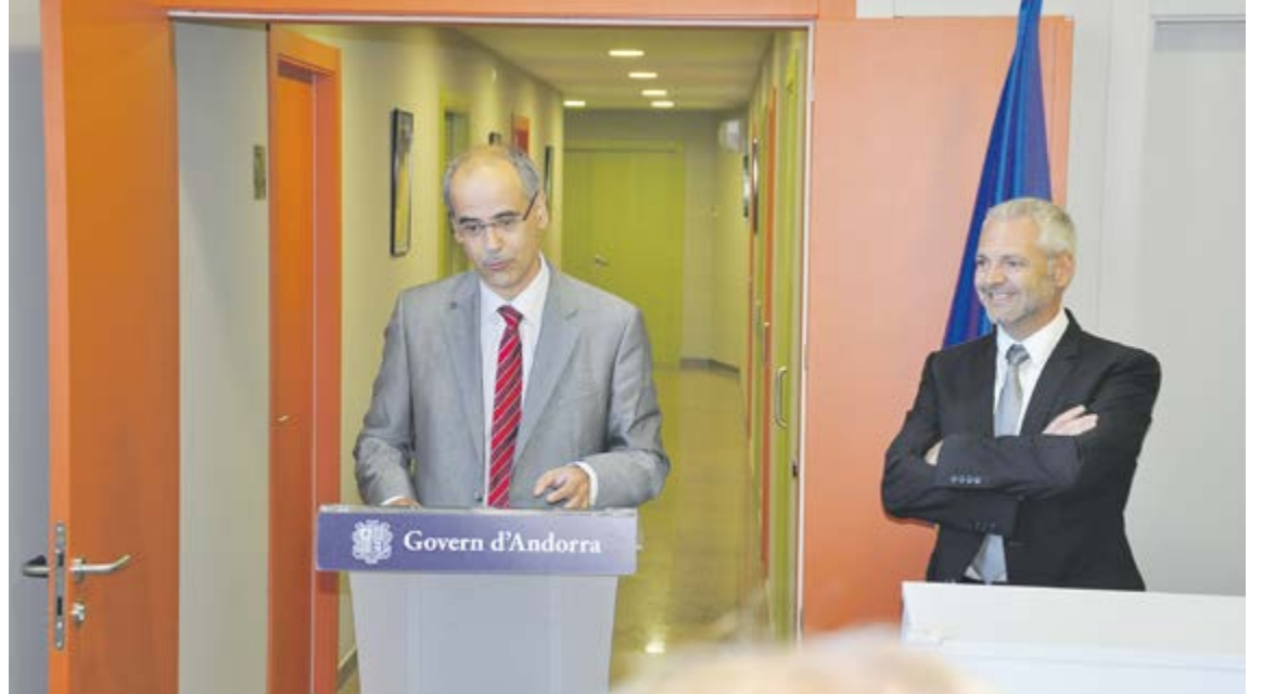
El cap de Govern, Toni Martí, va inaugurar les instal·lacions del nou CAP el 2014.

La inauguració del pati i el corral de Casa Rossell ha estat un pas més en la recuperació d'una de les cases més importants d'Ordino i d'Andorra. L'adequació de la casa segueix esperant que s'hi trobi un ús definitiu per reobrir el conjunt patrimonial.