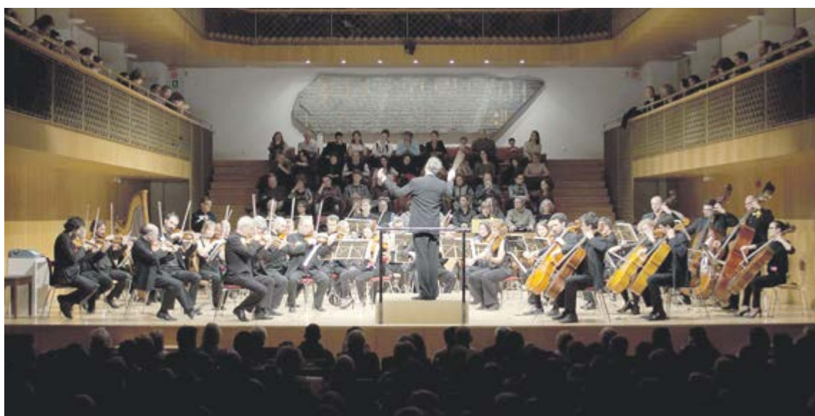
L'Orquestra Nacional Clàssica d'Andorra a l'Auditori Nacional.