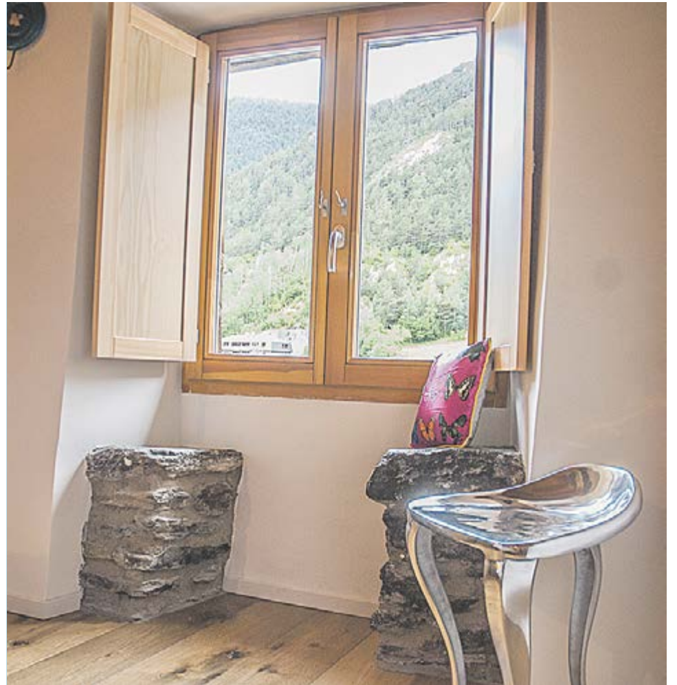
Aspecte del saló menjador, zona comuna de la casa amb mobiliari original reciclat, com la porta de l'esquerra. A la dreta, es pot veure la finestra amb festejadors.