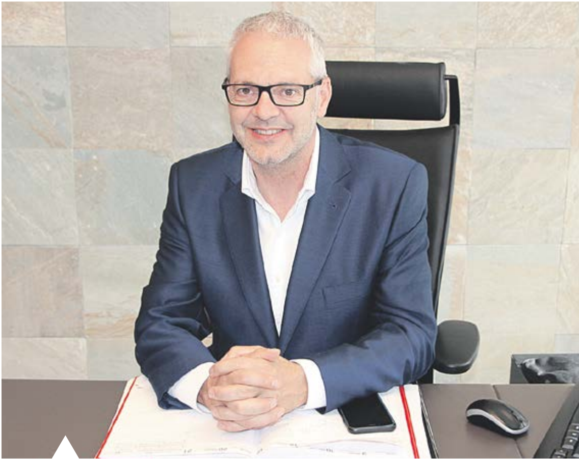
El cònsol Ventura Espot al seu despatx de l'edifici administratiu.