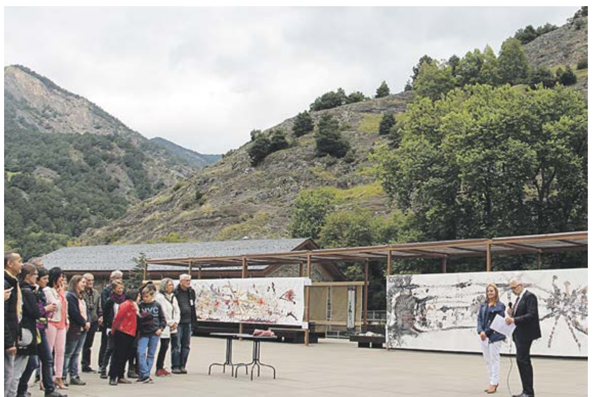
Moment de la cloenda a Prat de Call amb la presència de la ministra de Cultura, Olga Gelabert.