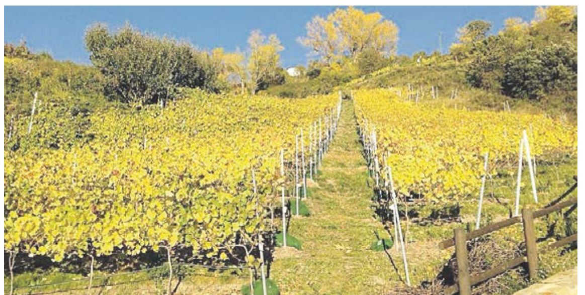
Les vinyes de l'explotació agrícola local de Casa Auvinyà, a Sant Julià de Lòria.

es dediquen a la producció pròpia i ecològica d'ous, llegums i horta. La sortida guiada es farà des de l'aparcament del COEX a Andorra la Vella quan faltin deu minuts per les 10 del matí. Dissabte i diumenge, l'Associació de comerciants del centre històric d'Andorra la Vella oferirà una mostra de productes locals que es vendran pels carrers del barri. Tothom podrà participar de l'efemèride tastant els menús creatius elaborats amb productes de proximitat que proposaran diferents restaurants. Els interessats trobaran els establiments a les webs d'Agricultura, www.agricultura.ad , i de la Unió Hotelera, www.uha.ad .