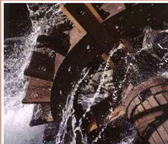
■ Ruta del Ferro Imatge de la roda hidràulica en funcionament de la Farga Rossell, centre d'interpretació del ferro que presenta una museística d'última generació.

El Museu Postal, el Museu de la Miniatura i el Museu del Cristianisme i d'ícones ortodoxes són tres propostes museístiques originals amb seu a Ordino. Visitant la Casa Museu d'Areny Plandolit us podreu fer una idea de com vivien les famílies nobles a Ordino i podreu reconstruir la història del Principat en el moment de màxima esplendor econòmica gràcies a la indústria del ferro. La serradora i la mola de Cal Pal, a la Cortinada, tenien una importància cabdal en l'economia agrària i rural de la vall. La instal·lació data de final del segle XVI, va deixar de funcionar a la dècada de 1960 i va ser restaurada i oberta al públic l'any 1996. Finalment, no us podeu perdre el Centre d'Interpretació de la Natura de la Cortinada, que us permetrà conèixer els diferents paisatges i els hàbitats d'Andorra, des del pont del riu Runer (838 m) fins al cim més alt de les Valls, el Comapedrosa (2.942 m).