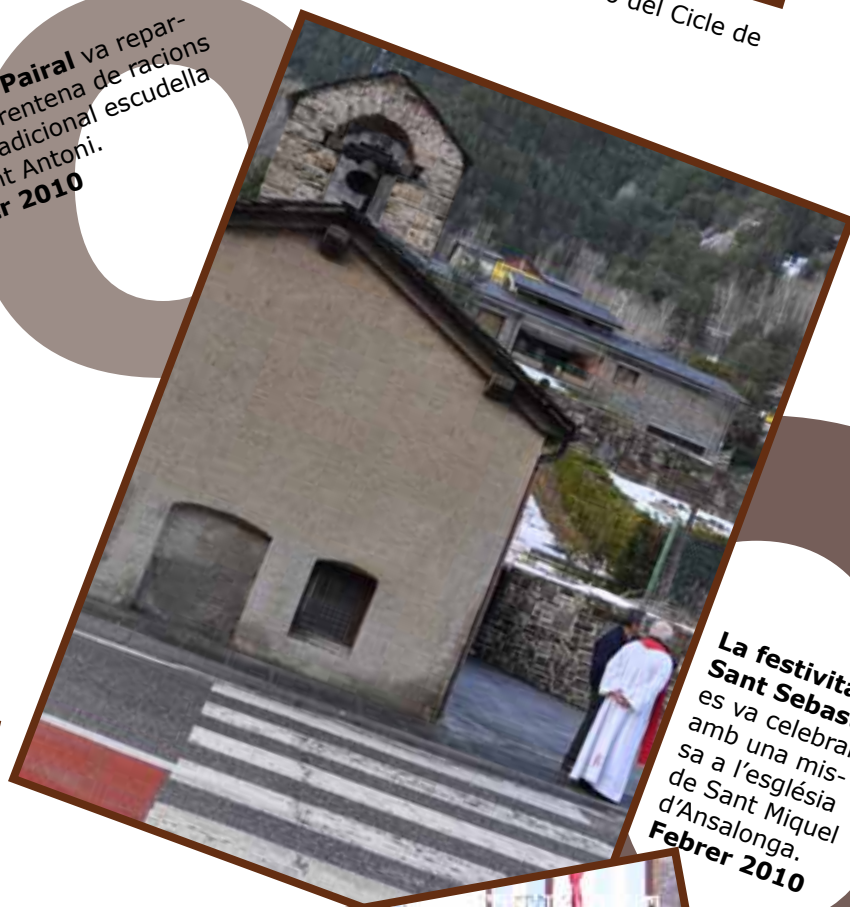
La festivitat de Sant Sebastia es va celebrar amb una missa a l'església de Sant Miquel d'Ansalonga. Febrer 2010