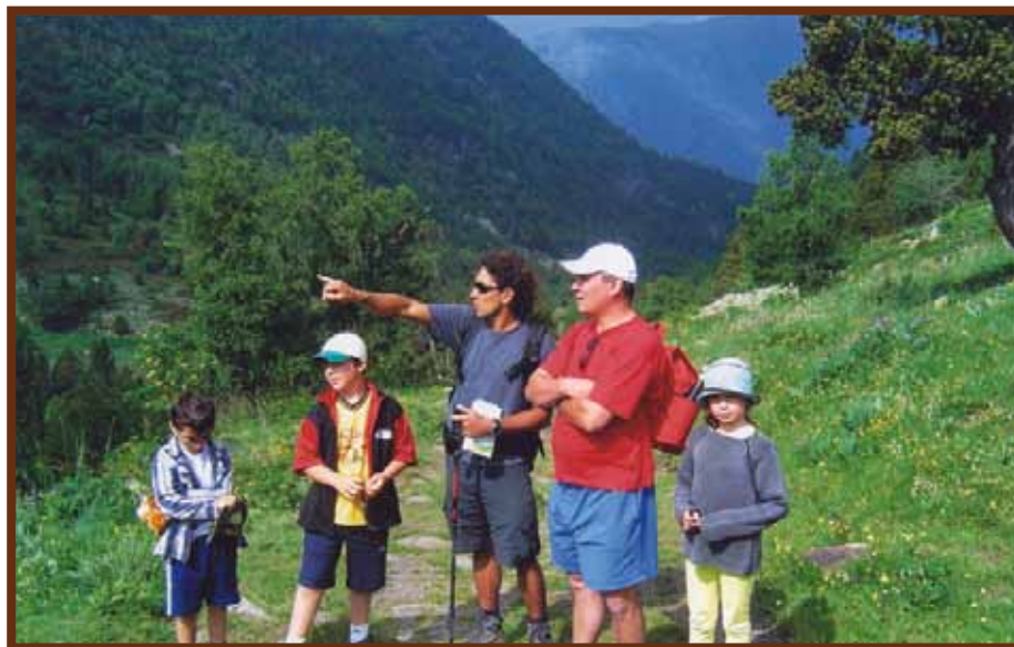
Un guia divulga informació sobre els hàbitats del parc als escolars.