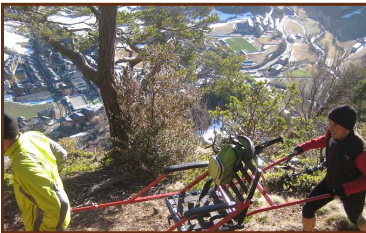
Membres de l'equip de l'organització en un reconeixement del terreny amb una «joëlette» el 6 de febrer passat.