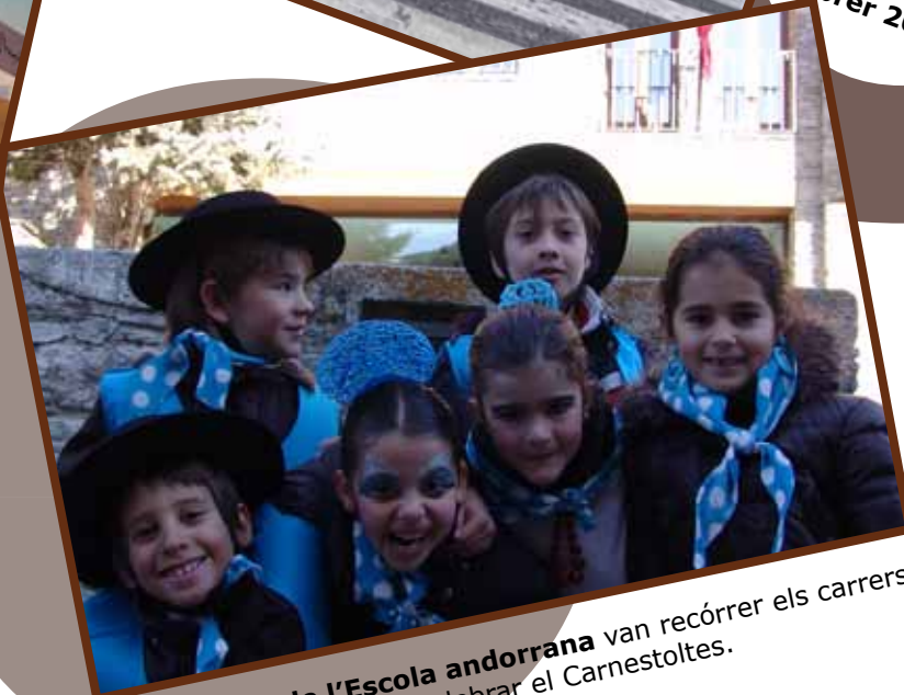
Els alumnes de l'Escola andorrana van recórrer els carrers vestits de flamencs per celebrar el Carnestoltes. Febrer 2010