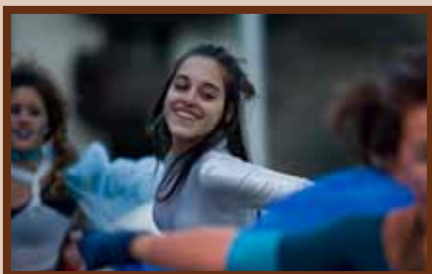
Cerimònia inaugural del Trofeu.

Reportatges Certamen literari Un Borrufa triomfal