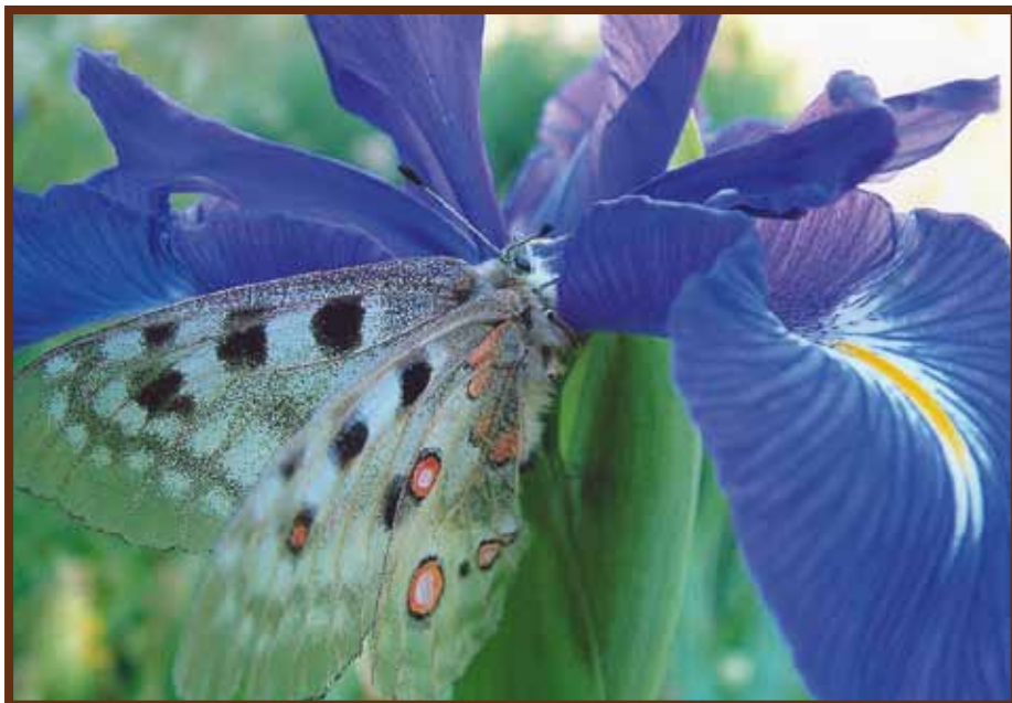
Una de les espècies de papallones que podem trobar a la vall posada en un lliri.

El camí ral era l'artèria principal que recorria tots els pobles de la parròquia fins al Serrat, abans que existissin les carreteres. A l'interès paisatgístic, cal afegir-hi l'atractiu històric, ja que reviu la indústria del ferro, que va ser motor econòmic a Ordino als segles XVII i XVIII. Podeu iniciar el recorregut a la mina de Llorts, també visitable, i arribar fins a la Farga Rossell. Al llarg del camí podreu admirar les obres contemporànies que conformen l'itinerari d'escultures dels homes de ferro, seleccionades a partir d'un simposi internacional. Reconeguda pel Consell d'Europa, la Ruta del Ferro forma part de l'itinerari Europeu del Patrimoni Industrial. L'accessibilitat des de diversos pobles i el desnivell mínim la fan ideal per a la pràctica del fúting i la bicicleta de muntanya.