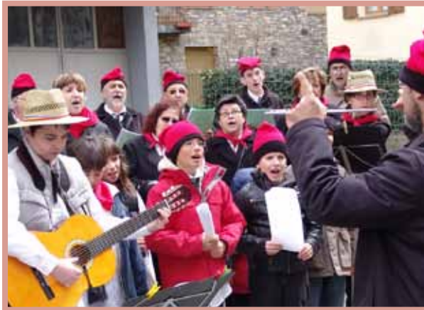
El Grup Artístic d'Ordino canta les Caramelles.

FINS AL DIMECRES 24 EXPOSICIÓ DE FOTOGRAFIA «L'ÍNDIA», D'ALFONS CODINA Cicle de cinema de muntanya i de viatges. Biblioteca comunal de la Massana