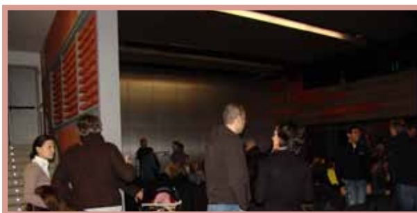
Assistents al Cicle de Cinema de muntanya i de viatges

DIMARTS 4 ADOLESCÈNCIA I CONDUCTES DE RISC (de 12 a 18 anys), A CÀRREC D'ANGELINA SANTOLÀRIA. Escola de mares i pares de les Valls del Nord Casa Pairal d'Ordino