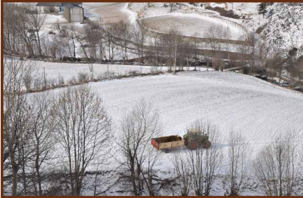
Vista general d'un dels espais naturals de la parròquia: els camps nevats de la finca de l'Any de la Part amb un tractor feinejant.

futures gaudir de la riquesa dels espais naturals i les zones protegides. La terra és un bé de tots, i tenir cura del paisatge i el patrimoni natural en el nostre cas és tenir cura de la nostra riquesa i invertir en futur. La Xarxa de Custòdia del Territori està pensada per aplicar-la a finques i zones d'especial interès natural, ja sigui per la fauna, la flora i el paisatge, o pel patrimoni cultural que acullen, tant si és de tipus forestal com agrari, fluvial, marí i fins i tot urbà.