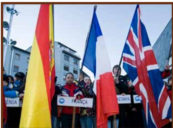
Les delegacions onegen orgullosos les banderes.

Però si hi ha un aspecte que sens dubte ha estat una injecció d'il·lusió al veterà Trofeu ha estat la presència d'esquiadors de la talla de Sébastien Amiez, Didier Schimdt i Jean Michel Abela, tots ells de nacionalitat francesa, campions del món i olímpics. Aquests convidats d'excepció van fer entrega de les medalles i van infondre als joves participants ganes per continuar lluitant en el món de la competició esportiva. «Comptar amb la participació de gent olímpica era un dels reptes de