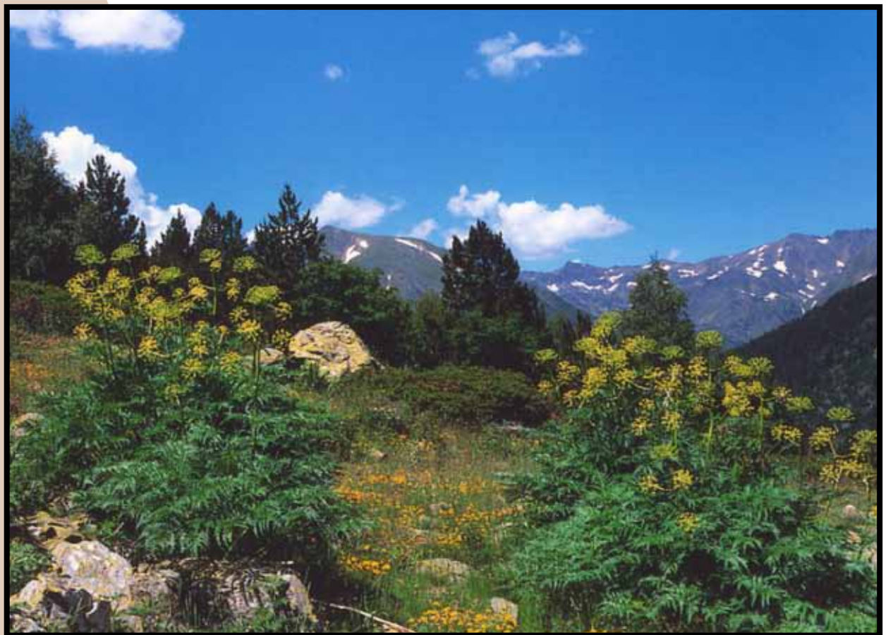
Panoràmica del Parc natural de la vall de Sorteny en plena explosió de vida a la primavera.

Aprofitem la celebració del Congrés Mundial de Turisme de Neu i de Muntanya per redescobrir l'entorn