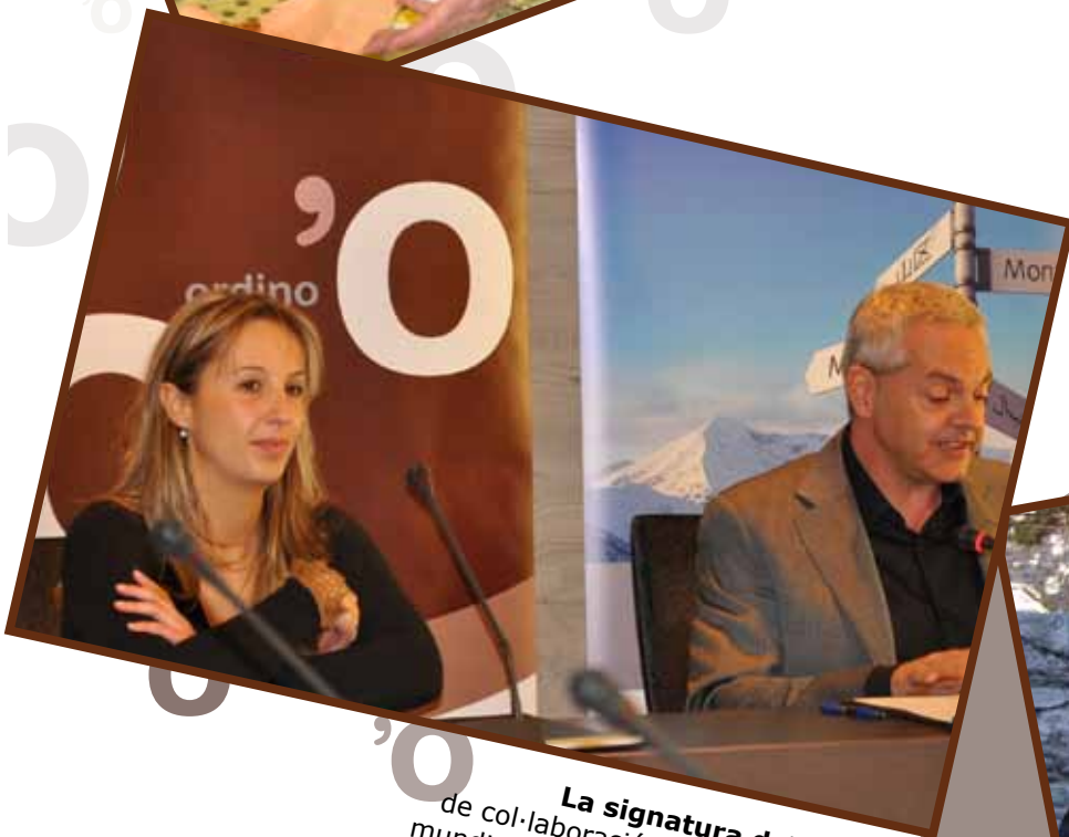
La signatura del conveni de col·laboració entre el 6è Congrés mundial de turisme i els professionals del país va tenir lloc a la sala del Consell. Febrer 2010