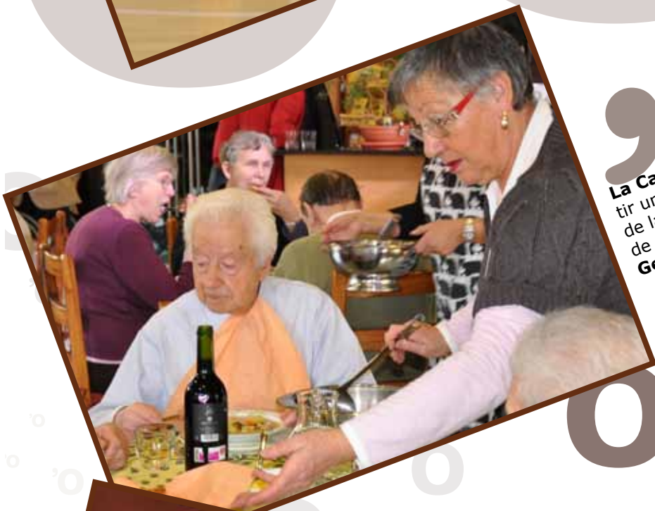
La Casa Pairal va reparar una trentena de racions de la tradicional escudella de Sant Antoni. Gener 2010