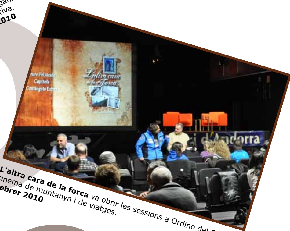
L'altra cara de la forca va obrir les sessions a Ordino del Cicle de cinema de muntanya i de viatges. Febrer 2010