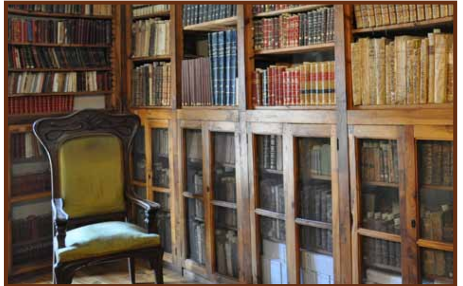
La biblioteca de la Casa Museu d'Areny-Plandolit és una de les joies visitables.