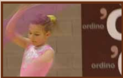
Exhibició de la secció de rítmica.