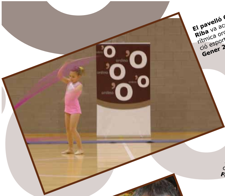
El pavelló Germans de Riba va acollir el Festival de ritmica organitzat per la secció esportiva. Gener 2010