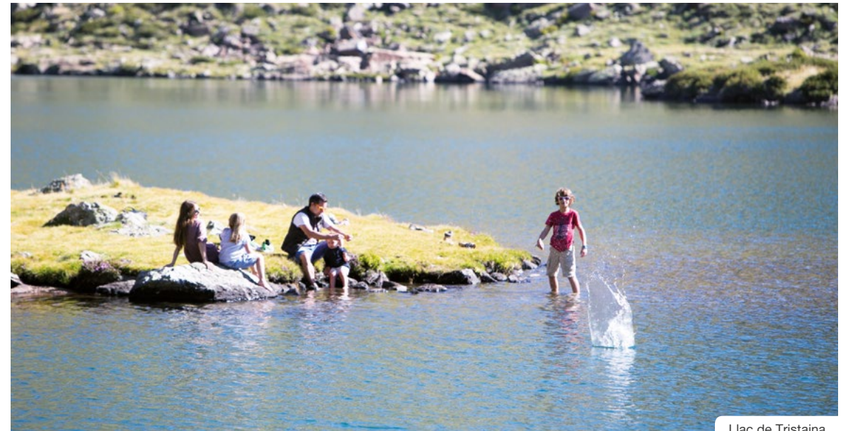
Llac de Tristaina