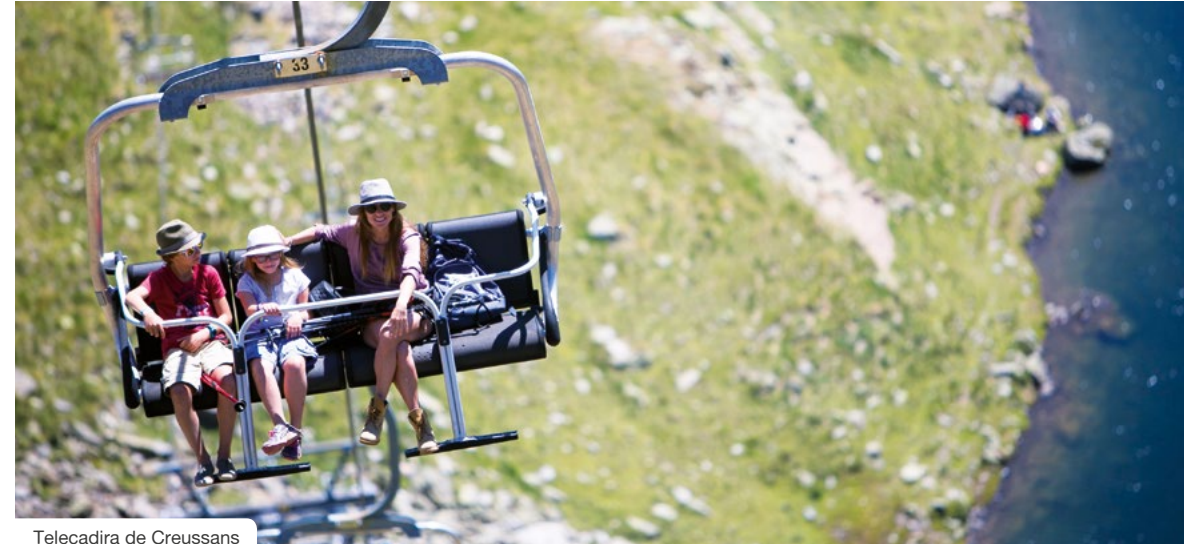
Telecadira de Creussans