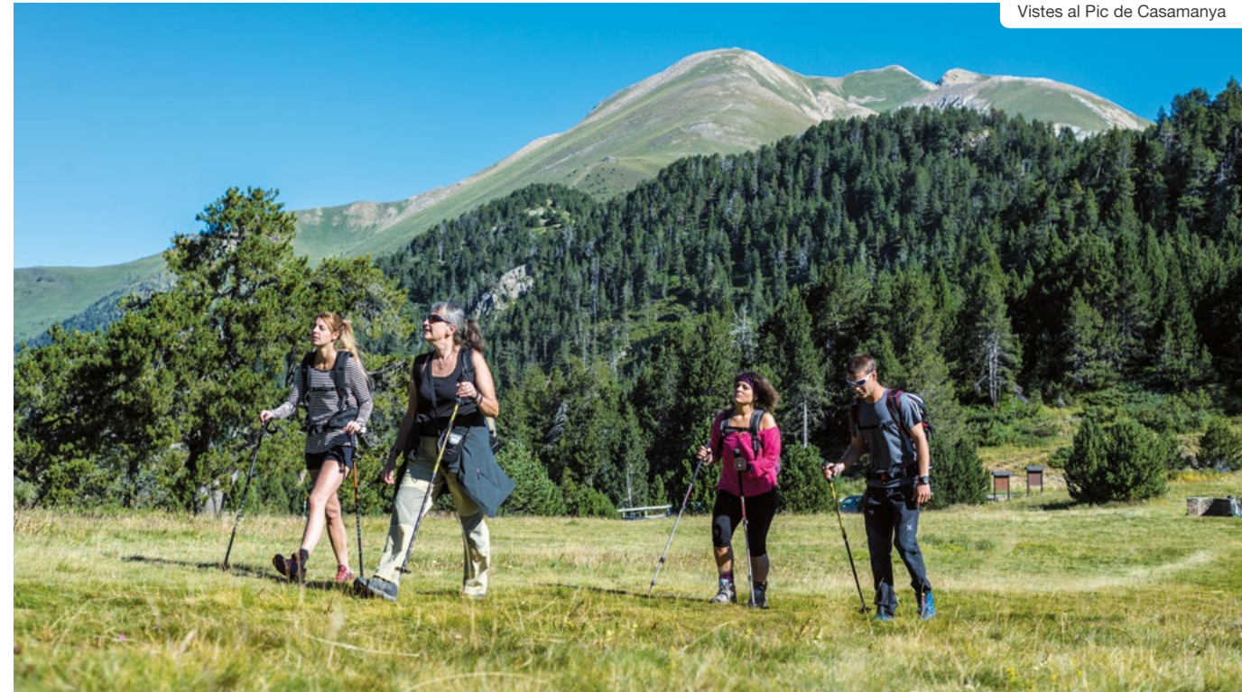
Vistes al Pic de Casamanya

En direcció a l'estació d'esquí es troben Arans i Llorts , aquest darrer amb l'atractiu de la mina i la Ruta del Ferro. Per Llorts s'accedeix a la vall de l'Angonella, que ofereix un espectacular paisatge de muntanya ple d'estanys. Per acabar, el Serrat , amb menys d'una cinquantena d'habitants, és la població a més distància de la capital de la parròquia. Es troba just abans d'arribar a Arcalís i als estanys de Tristaina, un bucòlic paratge de formació glacial, amb el pic que duu el mateix nom presidint la vall (2.878 m).