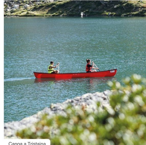
Canoa a Tristaina