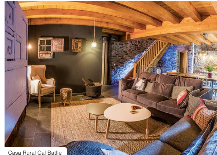
Casa Rural Cal Batlle