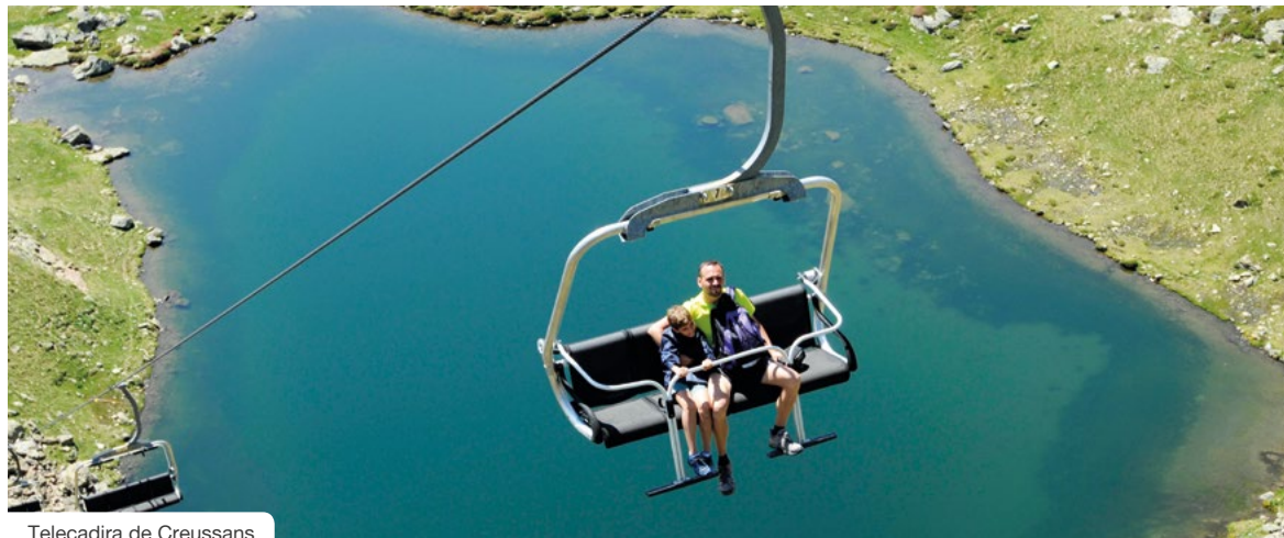
Telecadira de Creussans