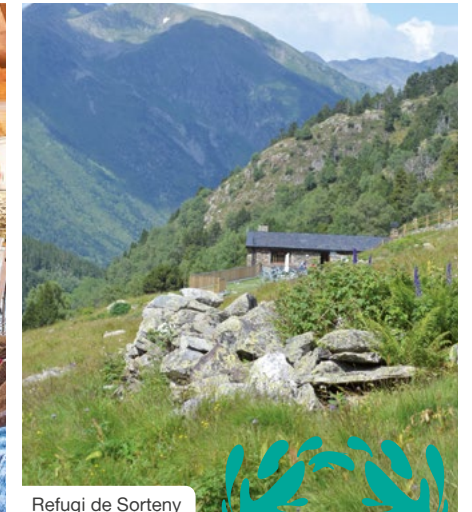
Refugi de Sorteny