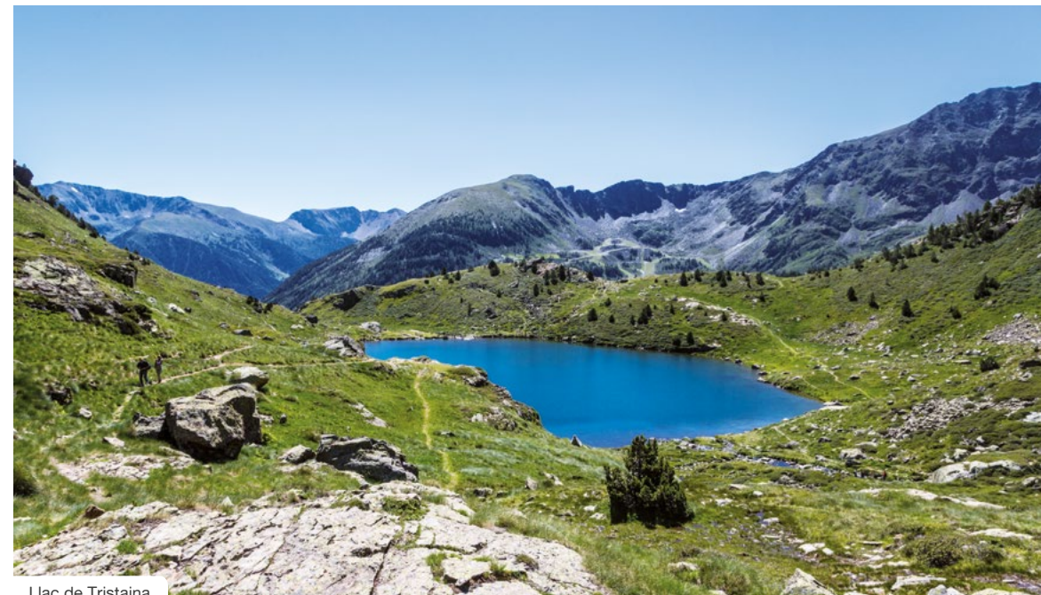
Llac de Tristaina