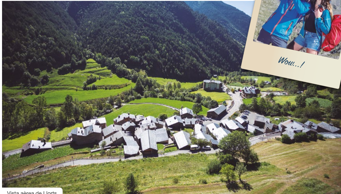
Vista aèrea de Llorts

Segudet i Ansalonga són dues petites poblacions molt properes a Ordino. El fet que entre les dues no arribin al centenar d'habitants fa que esdevinguin autèntics paradisos de la tranquil·litat. Igual que Sornàs , que també té aquella aroma tan encantadora de poblet de muntanya, on el temps s'atura i atrapa el visitant.